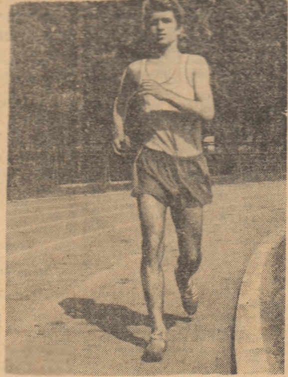
C. Stan, proaspătul recordman mondial, va lua startul duminică la cea de-a V-a ediție a Concursului Internațional de marș al României.

Marșul, de multe ori un fel de cenusăreasă a atletismului, a devenit vedeta acestui început de sezon. Cu două săptămîni în urmă, în cadrul primei etape a diviziei, Ion Găsiu a îmbunătățit recordul țării la 10 km, pentru ca după 7 zile Constantin Stan să depășească rezultatul lui Găsiu, realizînd totodată un nou record mondial al distanței. Continuînd această serie, la sfîrșitul acestei săptămîni vom avea prilejul să urmărim cea mai interesantă competiție de marș organizată vreodată în țara noastră. Este vorba de cea de a V-a ediție a Concursului Internațional de marș al României, la care și-au anunțat participarea mărșălăuții din 11 țări: Bulgaria, Cehoslovacia, Elveția, R.D. Germană, R.F. Germană, Italia, Polonia, Ungaria, Suedia, U.R.S.S. și România. Pe listele de confirmări primite la F.R.A. din partea federațiilor de atletism din aceste țări, figurează cîteva nume de mare rezonanță în