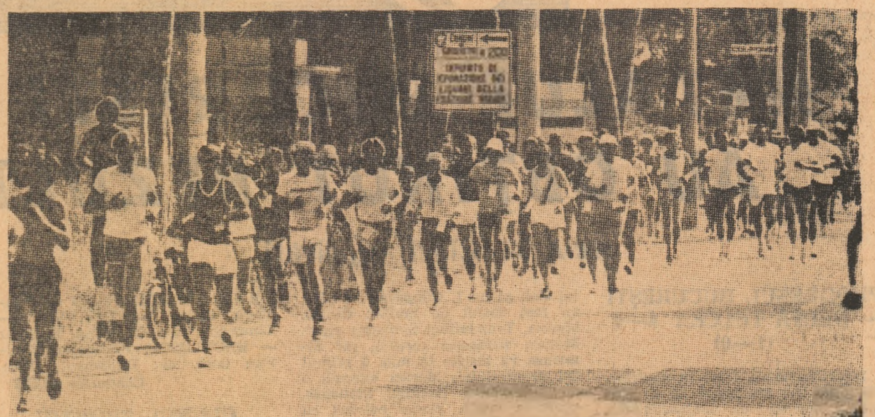
Aspect dintr-o cursă de „40.000 de pași“ desfășurată la Grosseto