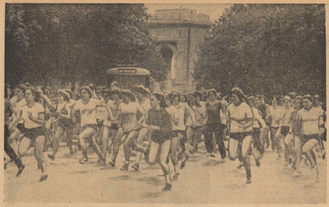
Din apropierea Arcului de Triumf s-a dat startul fetelor din cat. 15-17 ani, participante la crosul ziarului Informația Bucureștiului

ANUL XXIX — Nr. 7419 4 PAGINI 30 BANI Luni 21 mai 1973