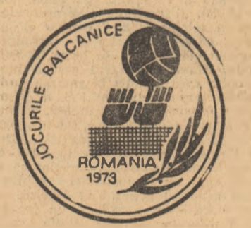
JOCURILE BĂLCANICE ROMANIA 1973