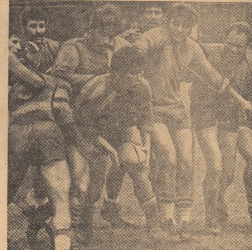
Fază din meciul Steaua-Universitatea Timișoara, Bucureștenii inițiază un atac