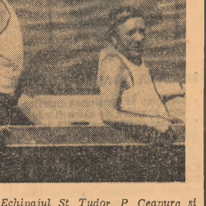
Echipajul St. Tudor, P. Ceapura și L. Lovrenscht este favoritul net al finaliștii din proba de 2+1.