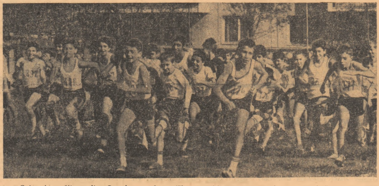
O imagine grăitoare din „Crosul cravatelor roșii”, competiție de masă care, în această primăvară, a imprimat cu alergarea și cu sportul mișcării și mișcării de copil.