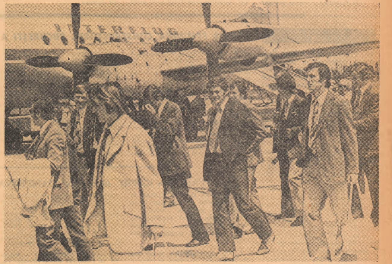
Fotbalștii din R. D. Germană, la coborîrea din avion pe aeroportul Otopeni...