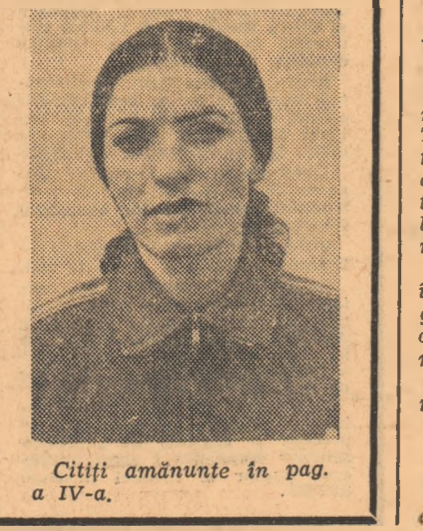
Cițiți amănunțe în pag. a IV-a.