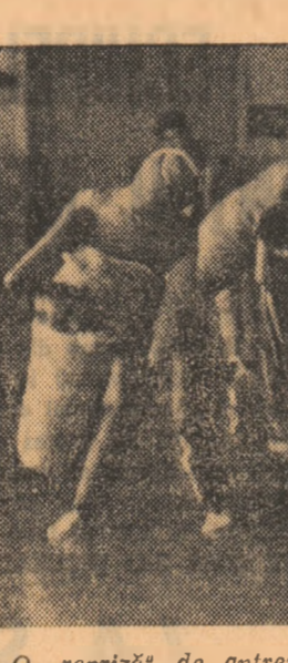
O „reprimă” de antrenament cu manechinele