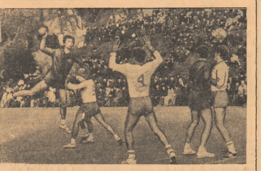
Azi, tradiționalul derby al campionatului masculin de handbal: STEAUA — DINAMO

Dintotdeauna meciurile dintre echipele masculine București au fost interesante dinamic și echilibrat. Azi, de la ora 18 (teren Dinamo), vom putea urmări o nouă ediție, ultima din acest campionat, a confruntărilor dintre aceste două