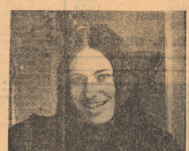
Ce ascunde „Argi” în spatele acestui zâmbet?