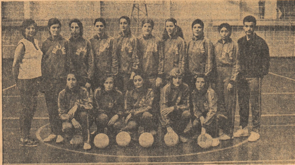
Reprezentativa feminină a României, campioană Balcanică