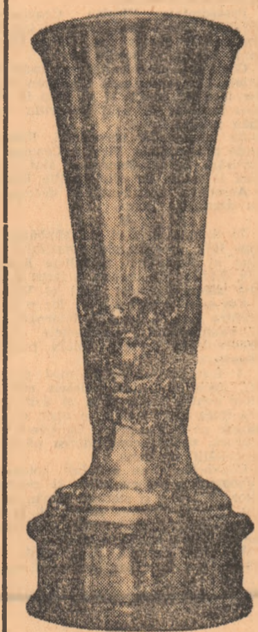
„Cupa Institutului de cultură fizică” oferită filmului românesc „Handbal, tehnica jocului” la cel de al II-lea Festival internațional al filmului sportiv de la Budapesta.