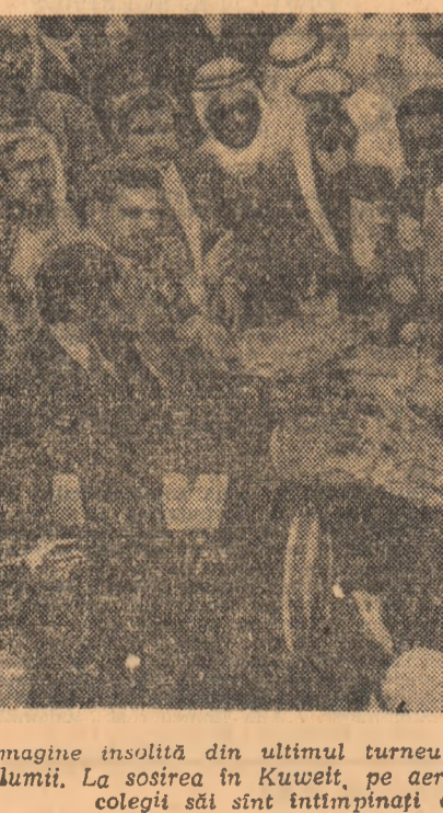
Imagine insolită din ultimul turneu al echipei F. C. Santos... În jurul lumii. La sosirea în Kuweit, pe terenul (în centrul imaginii) și colegii săi sint întâmpinați cu câldură și culoare locală...