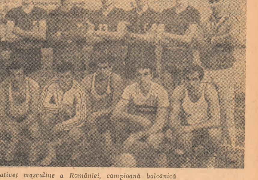
Lotul reprezentativei masculine a României, campioană balcanică