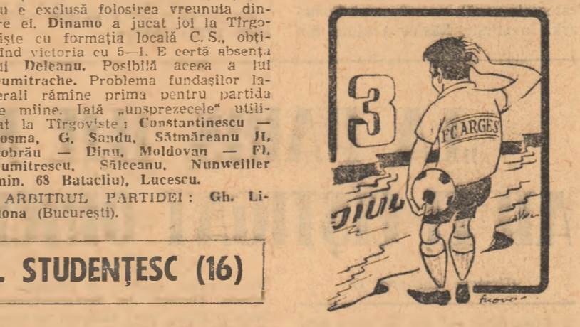
— Dacă aș reuși să trec dincolo, orgoliul meu de campion ar fi satisfăcut !!