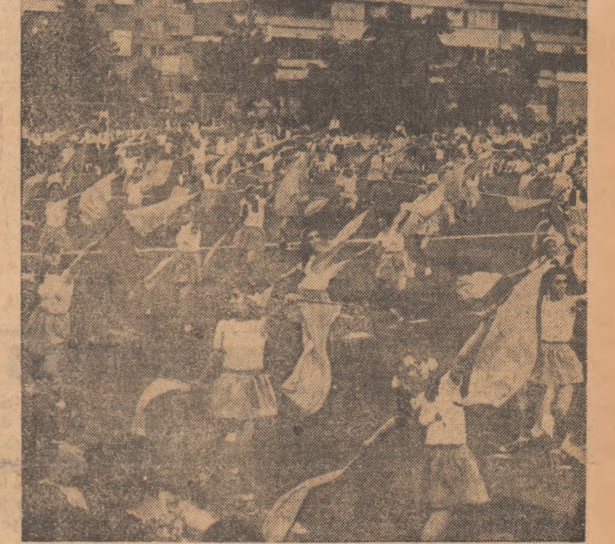
Aspect din timpul demonstrației de gimnastică modernă...

— Cu ce impresii reveniți de la Roland Garros? — Impresii de nesters. În primul rînd, este satisfacția victoriei. Mi-a fost dat, după ani de activitate pe terenurile de tenis, să văd un român ajuns la cea mai înaltă treaptă a performanței. Ilie Năstase este campion mondial, în tenisul pe zgură deci în tenisul cu cea mai mare răspîndire, jucat pe toate continentele. Apoi, am avut prilejul de a vedea meciuri de cel mai înalt nivel, cu toți asii rachetei reușiți în întrecere. Este un spectacol care nu se uită.