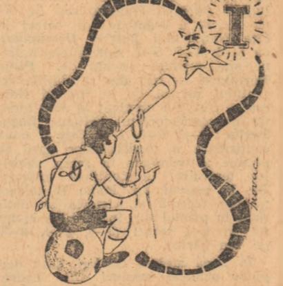
Tocmai acum mi se așază în față!

STEUA (6) - DINAMO (2) IUL (9) - F. C. ARGEȘ (4)