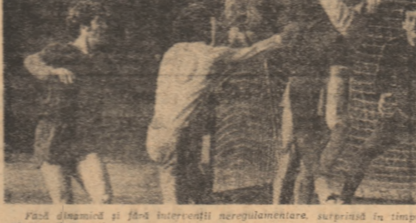
Fază dinamică și fără intervenții nereglementare, surprinsă în timpul unui meci derby dintre Steaua și Dinamo București.