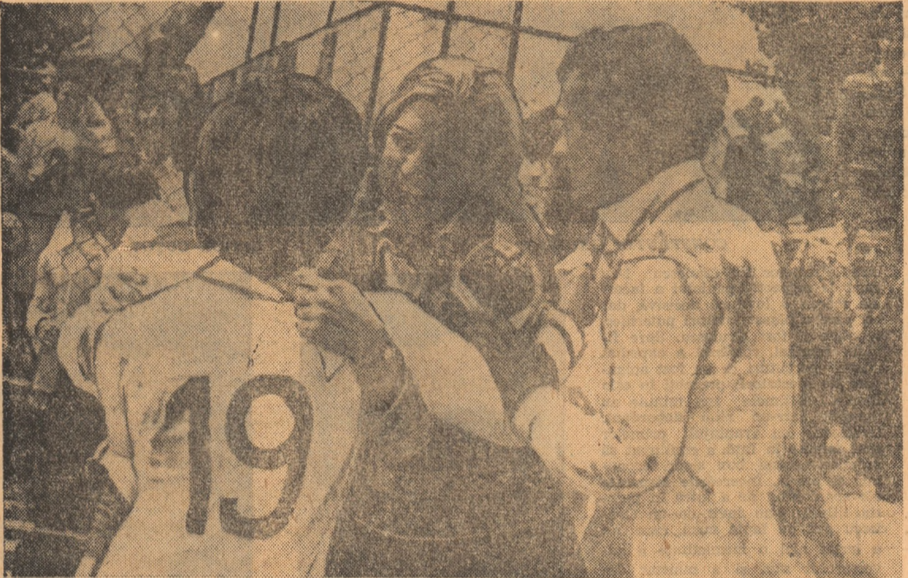
Entuziasm și recunoștință...