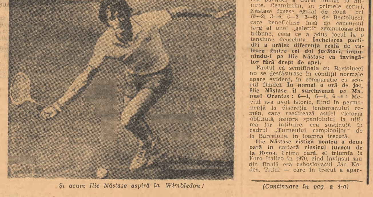
Si acum Ilie Năstase aspiră la Wimbledon!

● 6-0 la continuarea semifinalei cu Bertolucci ● 6-1, 6-1, 6-1 în finala cu Orantes I ● Avans de aproape 100 p. în Marele Premiu — F.I.L.T. ROMA, 11 (prin telefon). — Campionatele internaționale de tenis sînt în desfășurare și astăzi, în condiții de mare competiție mondială pe terenuri cu zgură, s-au încheiat cu succes categoric al campionului român Ilie Năstase, „Acros” în mod neașteptat, de italianul Paolo Bertolucci, în semifinale, el s-a impus în schimb foarte rapid la reluarea partidei cu acesta, pentru a