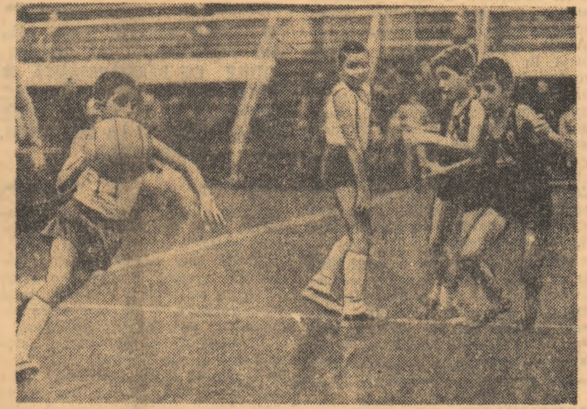
Virtuza fragedă nu exclude îndemnarea în regim de viteză, demonstrează meciul baschetalist aflat în plin dribling. La Suceava, publicul va avea prilejul să apiaude din nou evoluția participanților la tradiționalul Festival al minibaschetaliștilor

De la 1 la 12 iunie a.c. o delegație a Consiliului Național pentru Educație Fizică și Sport, condusă de generalul Marin Dragnea, prim-vicepreședinte, a făcut o vizită în R. P. Chineză, la invitația Comitetului pentru Cultură Fizică și Sport din Republica Populară Chineză.