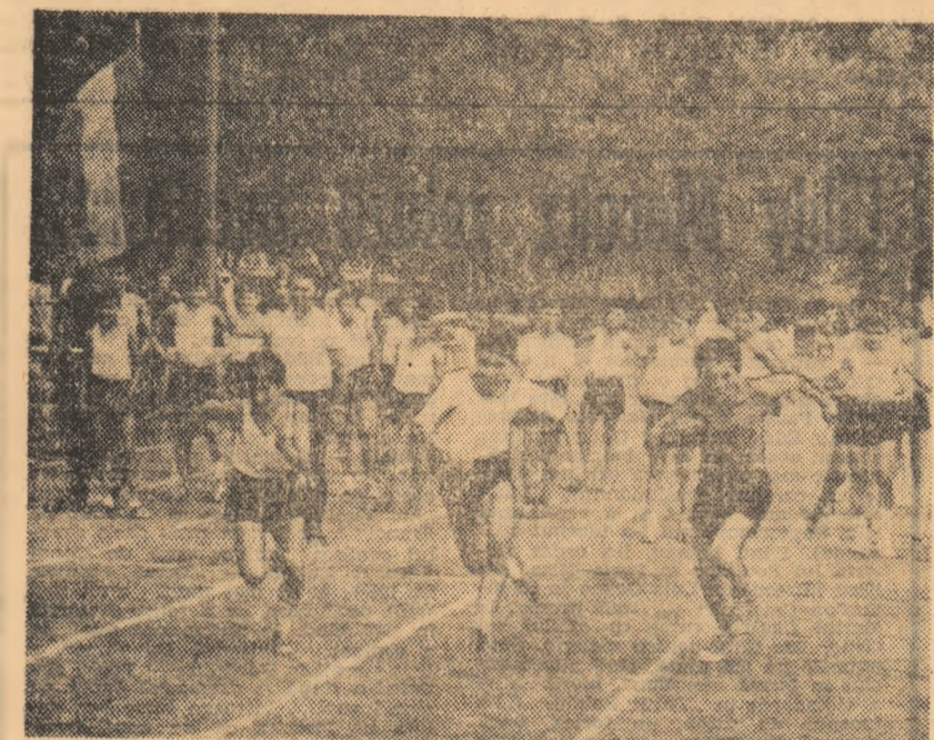
Unul din zecile de starturi în proba de alergări...

„Larmă juvenilă pe stadionul Tineretului. Niciodată, parcă, bătrina arenă de lângă Acul de Triumf, leagăn al sportului bucureştean, nu s-a meritat mai bine numele, n-a fost strălucită atât de total de tinerete ca în dimineaţa de ieri.