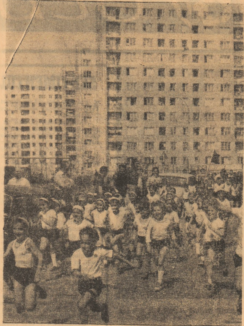
Prima întrecere, primii pași în sport...