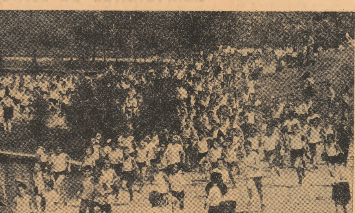
Parcul din Balta Albă este locul preferat al amatorilor de întreceri sportive din acest mare cartier

În vederea competițiilor la care vor fi prezentați în sfîrșit acestesăptămîni, minisportivii de la „Cutezătorii” au susținut ultimele prepa-