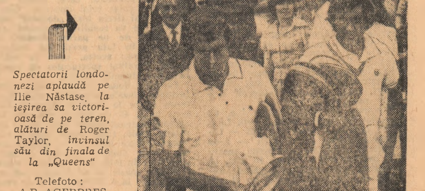
Spectatorii londonezi aplaudă pe Ilie Năstase, la ieșirea sa victorioasă de pe teren, alături de Roger Taylor, invinsul său din finala de la „Queens”