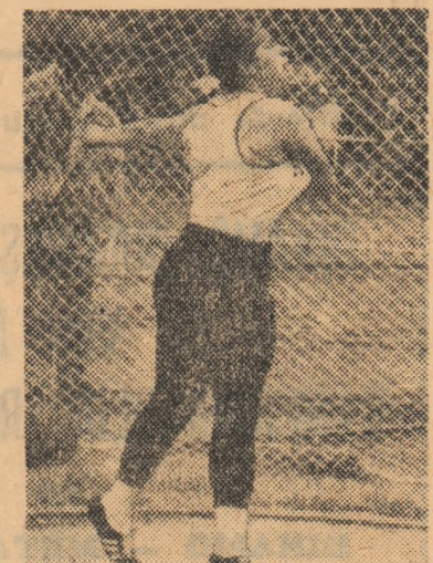
Pe stadionul din Frankfurt, Argentina Menis în cercul de aruncări

de Meta Antenen și Viorica Viscopoleanu!