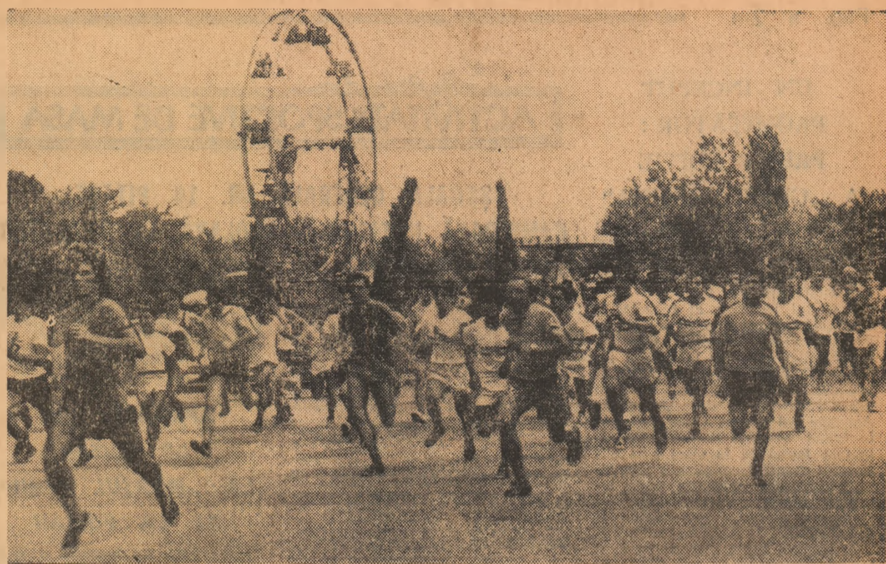
Duminică dimineața în Parcul Herăstrău, la marea serbare sportivă populară. Aspect din timpul desfășurării probei de cros.