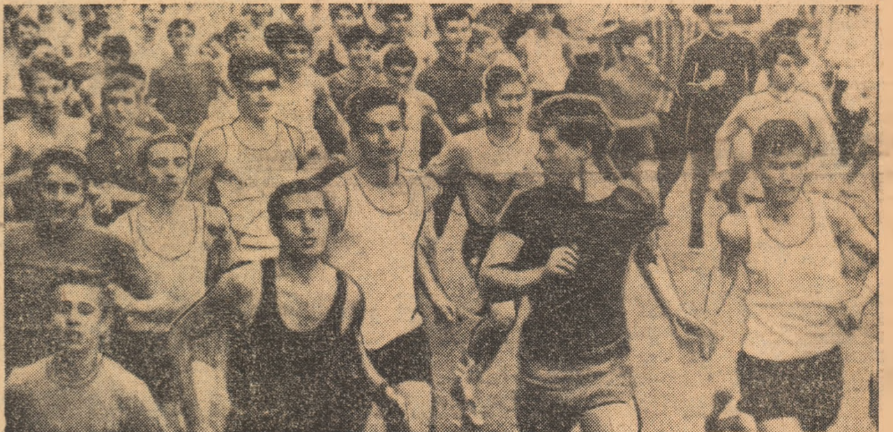
Alergarea de cros își păstrează nealterată popularitatea...

La competiția feminină și-au anunțat participarea formațiile Bulgariei, Cehoslovaciei, Japoniei, Ungariei, Poloniei și, bineînțeles, României, echipe care s-au afirmat prin succese de prestigiu în arena internațională. Să notăm și faptul că „Trofeul Tomis” constituie, una dintre cele mai importante competiții voleibaliste ale anului, dinaintea Universiadei și „Cupei Mondiale”.