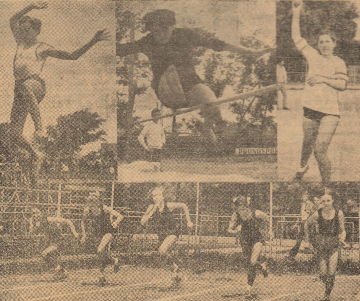
Un fotomontaj de la tetralionul atleticeleor din Buzău — așa faze județeană

Ca sportul luptelor este îndrăgit în județul Galați o vedeți în primul rând, faptul că în ultimii ani pe aceste meleaguri au luat ființă numeroase centre de pregătire.