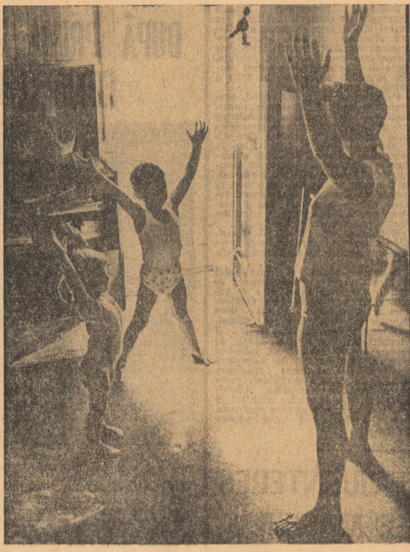
Ziua începe cu un scurt program de gimnastică de împiorare, în familie.