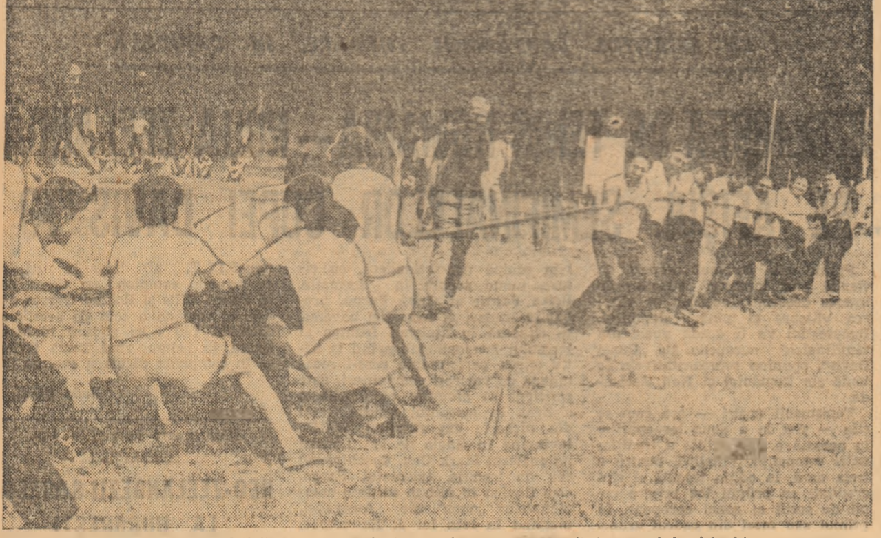
O intrecere populară care câștigă tot mai mult teren: încercarea puterii în trasul la frînghie.