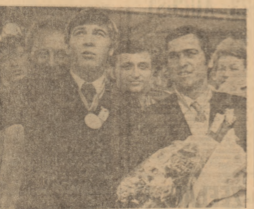
Cu brațele încrucate de flori la soseirea în Gara de Nord a campionilor europeni Constantin Gruescu și Simion Ciujov

● Invs la... pescuit de fetițele sale ● Primire caldă pe meleagurile natale ● Vacanța a fost frumoasă dar campania de naționale bat la ușă! ● Campionul european ținește și alte victorii.