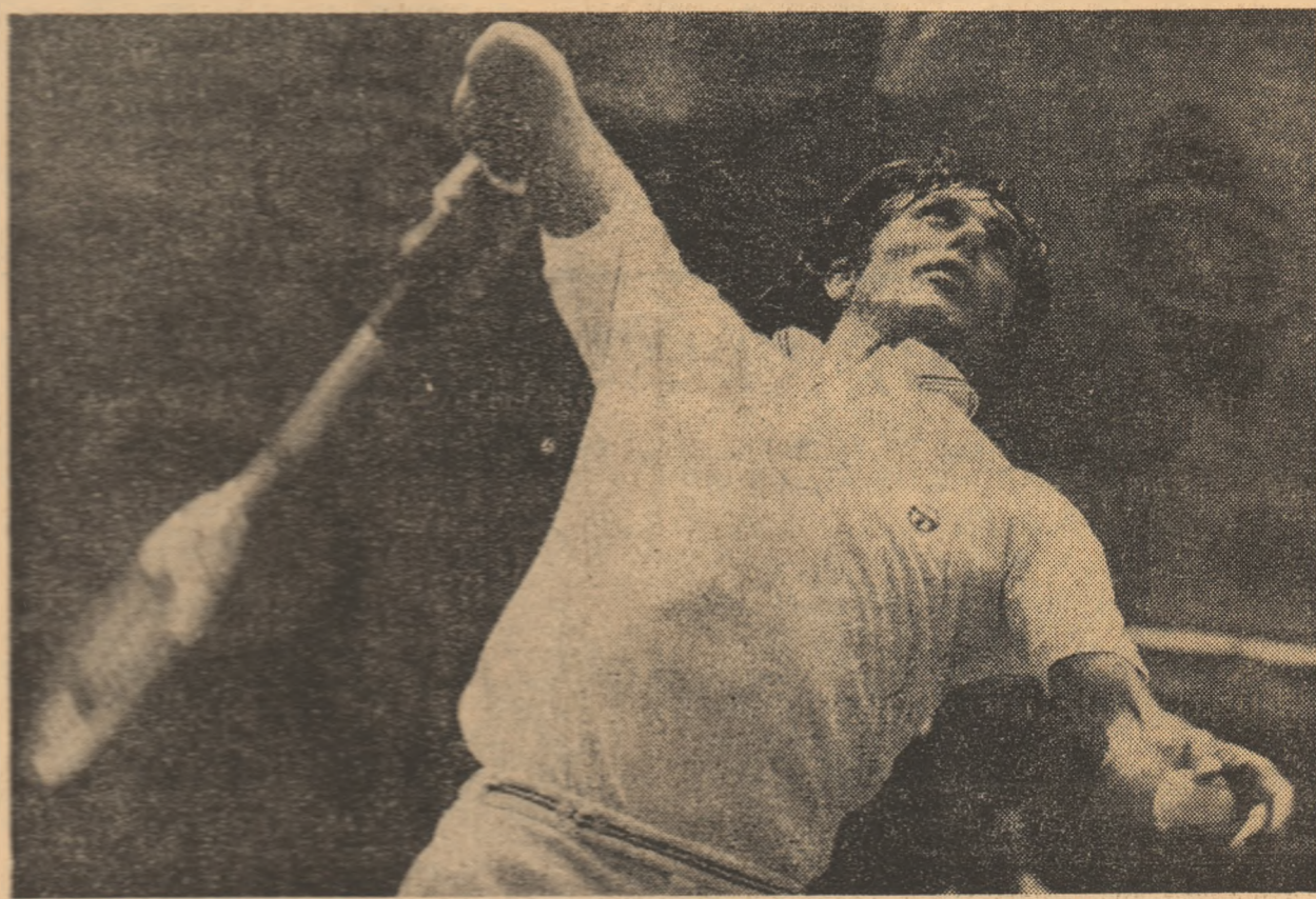
Île Năstase, încheie victoria alături de tenismanii din Elveția, la Gstaad, așa cum dorim să-i vedem merge, vânzând cea mai puternică prindă antrenarea lui această, împlinirea a 27 de ani.

Pe stadionul ceasornicului orele alergă parcă mai încet acum, când ne desparte doar o singură zi până la mult așteptatul start. De mine, la Progresul, vor sta față în față echipele României și Noii Zeelande, în meciul care trebuie să desemneze pe una din finalistele primei grupe europene a „Cupei Davis”. Până atunci, așteptăm, pregătiri.