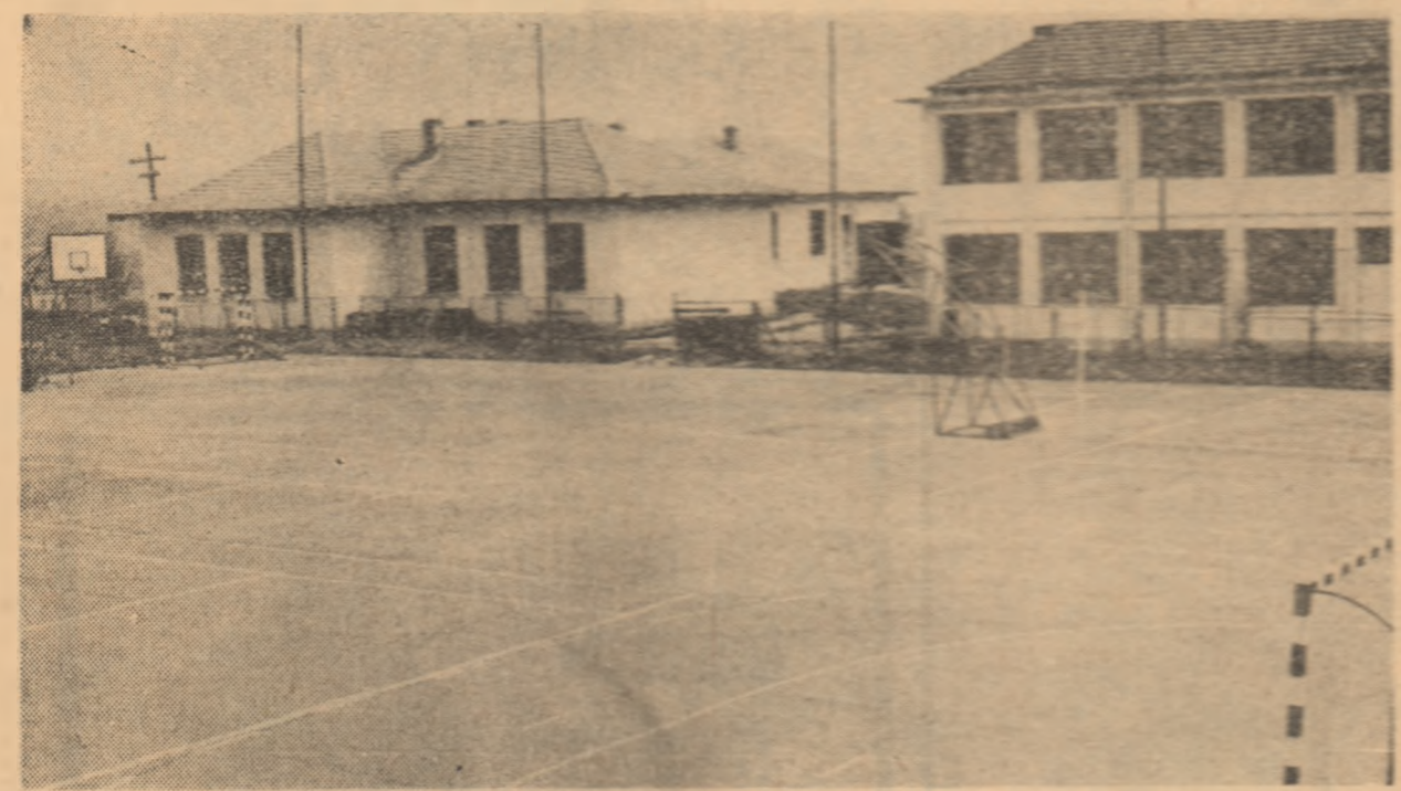
Frumoasa bază sportivă a Liceului din Tg. Cărbunești trebuie folosită intens și în perioada vacanței de vară a elevilor.

Continuînd raidul nostru în județul Gorj, am făcut un nou opas, de această dată în orașul Tg. Cărbunești, care s-a făcut remarcabil prin bunele rezultate obținute în campionatele cu caracter județean, dar și prin cîteva elemente talentate, care s-au evidențiat în întrecerile de nivel republican. Cunoscind, de asemenea, că aproape un sfert din populația localității o reprezintă tinerii, am fost cu alți mai dornici de a afla în ce măsură prevederile Hotărîrii Plenare C.C. al P.C.R. din 28 februarie — 2 martie a.c. și-au găsit loc în preocupările forurilor locale și ale organizatorilor în acest domeniu pentru ridicarea sportului pe o treaptă calitativă superioară, cum s-a acționat pentru transpunerea în fapt a sarcinilor trasate de partid.