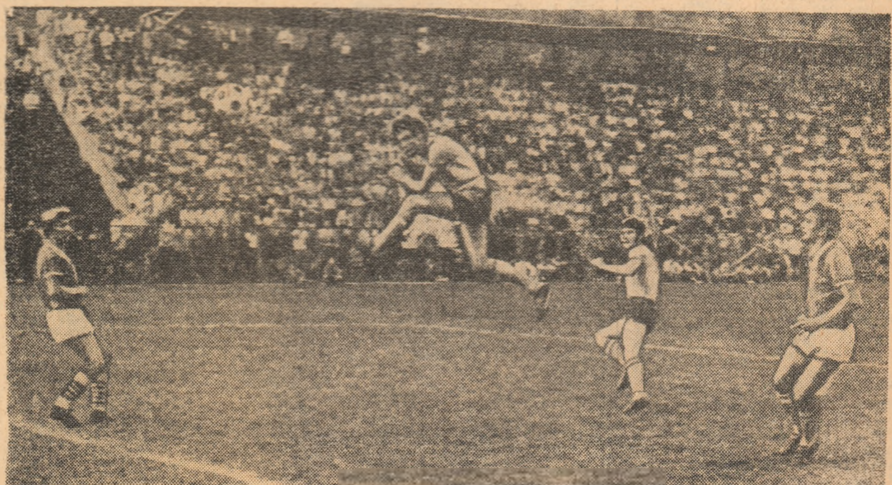
Moment din jocul de marți, de la Cimpina, al lotului reprezentativ: Dugu Georgescu reia spectaculos capul, balonul spre poarta adversă.