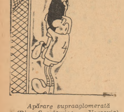
Apărare supraaglomerată (Din „Sportowiec“ — Varșovia)