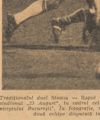
Tradiționalul duel Steaua — Rapid va fi reeditat simbă 4 august, pe stadionul „23 August”, în cadrul celei de a VII-a ediții a „Cupei Municipiului București”. În fotografie, un moment din partida dintre cele două echipe disputată în returul campionatului.

Se dovedește a fi excelentă inițiativa Biroului Executiv al C.N.E.F.S. de a pune în discuția opiniei publice proiectele de regulament ale Complexului „Sport și sănătate” și Competiției de masă cu caracter republican. Devine tot mai gros teancul corespondențelor sosite — pe această temă — la redacție. Profesori de educație fizică, antrenori, instructori, activiști și alți tehnicieni ai mișcării sportive au răspuns prompt și foarte riguros la apelul ce le-a fost adresat. De a-și expune părerea asupra celor două documente. Studiind numeroase scrisori primite, încercînd să sistematizăm pe grupe de probleme ideile exprimate în ele, propunerile făcute, ne dăm seama că dezbaterea prilejuiește un excelent schimb de opinii, are virtutea de a îmbogăți în mod considerabil textele inițiale ale regulamentelor, de a le aduce perfectări. În acest context, am sugera Biroului Executiv al C.N.E.F.S. să prelungească pînă la 1 septembrie termenul discuției publice a proiectelor, pentru a da — pe o parte — posibilitatea unui număr și mai mare de specialiști de a-și spune punctul de vedere, iar — pe de altă parte — să se poată corobora nu-