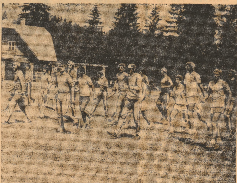
Lotul jucătorilor craioveni este gata pentru primul antrenament al zilei. Este ora 7,30 și lupta cu kilometri va începe...