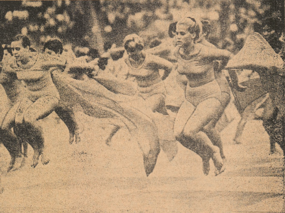
Asemenea demonstrații de masă vor inaugura azi, la Berlin cea de-a X-a ediție a Festivalului mondial al tineretului și studenților.