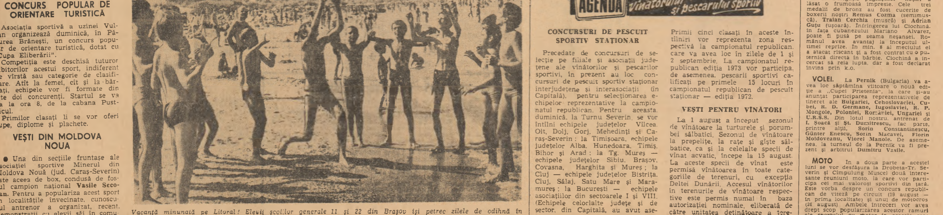
Vacanță minunată pe Litoral! Elevii școlilor generale 11 și 22 din Brașov își petrec zilele de odihnă în tovarășia mării, a soarelui și, a mingii.