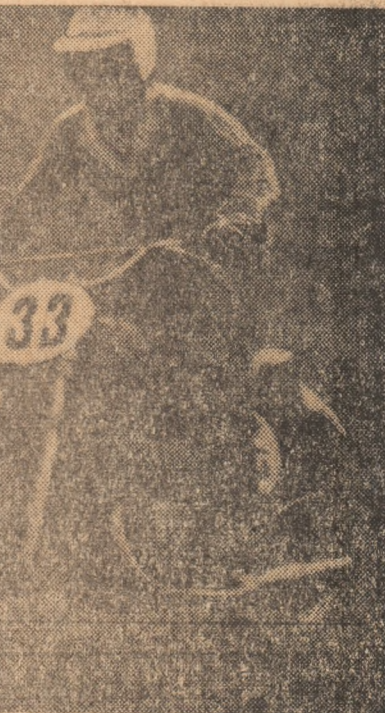
Din toate sporturile

Facind bilanțul disputelor, nu jului de cunoștințe tehnice și me-canice ale elevilor lor. Afirmăm, fără teama că vom exagera, că u-nii antrenori sau instructori nu au prelucrat cu acești tineri nici mă-car regulamentul campionatului, deosebite la începutul competiției o serie de juniori n-au cunoscut sem-nalele arbitrilor principal sau clauzele după care se aceluiesc clasamentele.