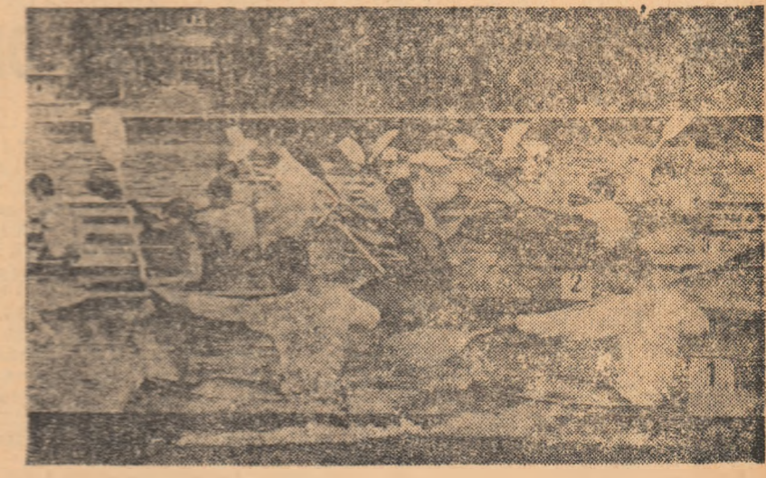
Start „furtunos” în proba de caiac patru rezervată juniorilor mici