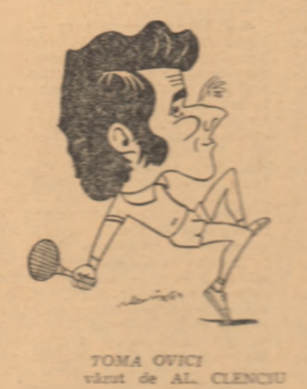
TOMA OVICI vînt de AL. CLENCIU