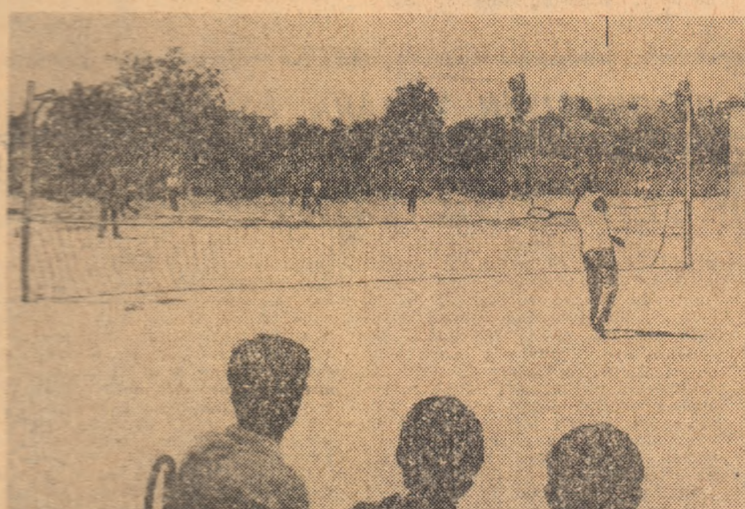
În curtea liceului din Vinju Mare s-a turnat un strat de bitum și terenul de tenis e gata. Desigur, mai e nevoie de un fileu bun, de rachete și mingi, de echipament. Dar începutul e promițător

Continuăm raidul nostru în județul Mehedinți. Am părăsit Orșova la primele ore ale dimineții. I-am mai privit odată splendida panoramă și ne-am luat la revedere de la frumosul oraș, promițînd, în sinea noastră, că vom mai reveni prin aceste splendide locuri.