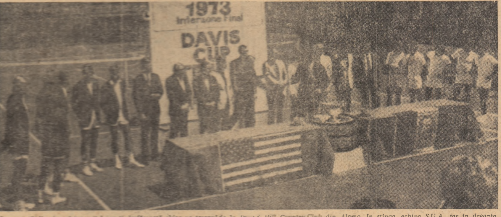
O scenă din timpul traversii la serpi desfășurată chiar pe terenul de la Round Hill Country Club din Alamo. În stînga, echipa S.U.A., iar în dreapta, reprezentanții României. În fața celor două formații, fîmosele „Solărești de argint”.