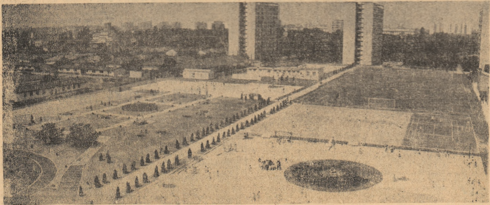
Străjuț de împănătoare blocuri de locuințe, complexul „Voinicelul“ invită, prin frumusețe, la sport și agrement

● COLOANA SPORTIVILOR care vor defila în Capitală, prin fața tribunei oficiale, va fi formată din peste 6 000 de tineri ● ÎN ZIUA MĂRII SĂRBĂTORI, în întreaga țară tinerii muncitori, ostași, elevi se vor întrece în competițiile de masă dedicată zilei de 23 August, la peste 20 de discipline ● TOATE BAZELE SPORTIVE ȘI DE AGREMENT DIN BUCUREȘTI vor găzdui mari întreceri de masă, cea mai atrăgătoare fiind etapa finală a „Cupei 23 August“ la șase romuri ● PE UN TRASEU DE 10 KM, ÎNTRE BAILE FELIX ȘI MUNICIPIUL ORADEA, peste 1 000 de tineri vor purta mesajul prielivuit de grandioasa competiție: „Ștafeta 23 August“ ● LA ARAD, BAIA MARE, SUCEAVA, TG. MUREȘ, mii de tineri din peste 500 de asociații sportive vor petrece ore plăcute în aer liber, în compania exercițiilor fizice și sportului.