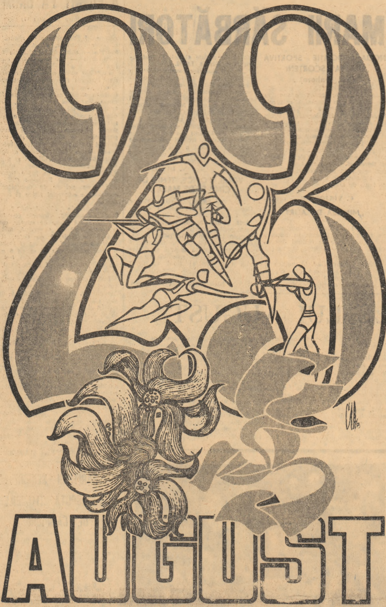
Desen de N. CLAUDIU