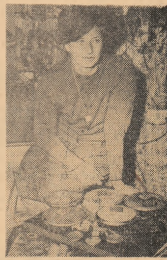
Lia Manoliu, campioană olimpică

tul românesc își sporește în permanență eforturile, pe toate planurile, pentru a se menține în ritmul de progres al celorlalte domenii ale vieții sociale, pentru a aduce ca prinos de recunoștință performanțe tot mai înalte în marile confruntări sportive mondiale. Există premise pentru ca în anii care urmează succesele să fie tot mai numeroase, tot mai prețioase.