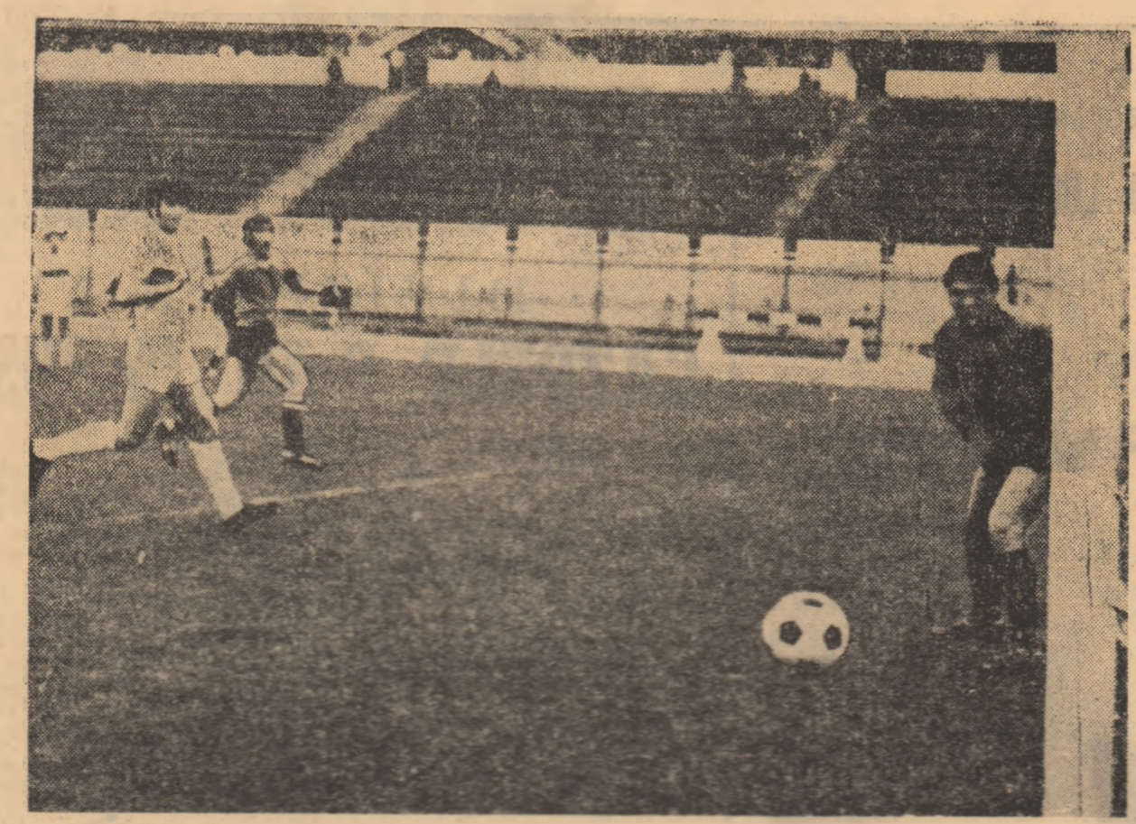
Mircea Sandu (tricou de culoare închisă, în mijloc, strîngînd) a devenit mingea cu capul, marcînd al doilea gol al Sportului studențesc în meciul cu S. C. Botoș.