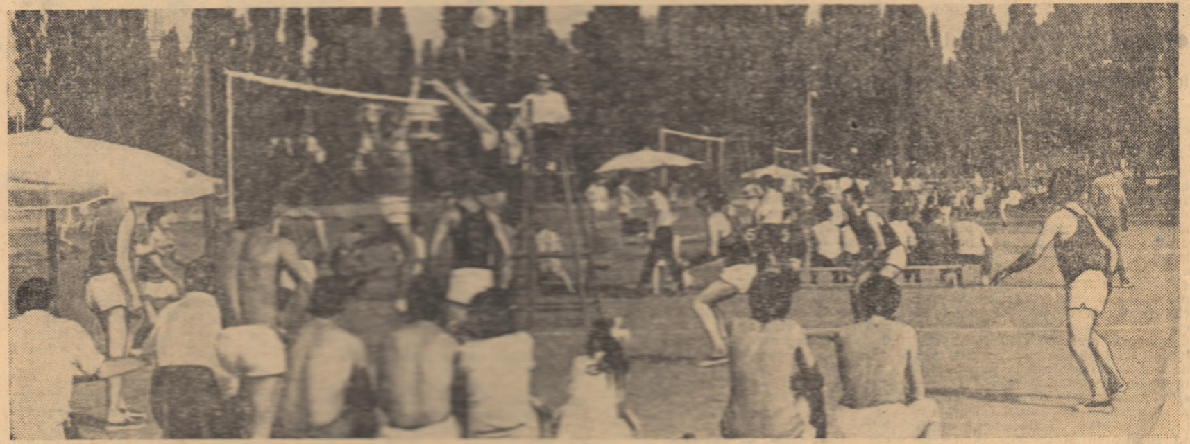
„Cupa tineretului de la sate” la volei și oină