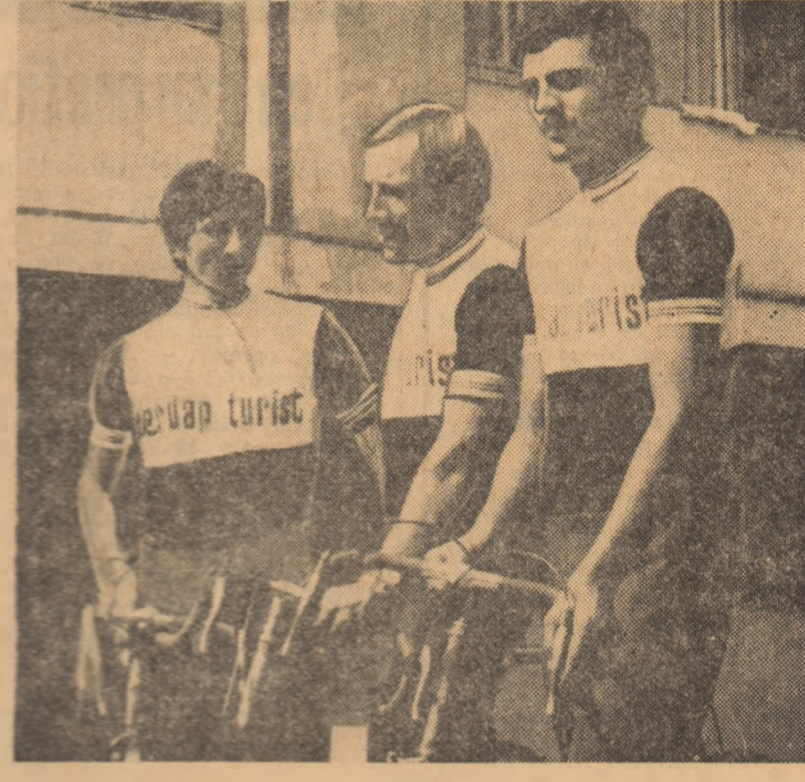
Trei dintre cei cinci componenți ai reprezentativei Iugoslaviei pozând înaintea startului în „Turul României”.

O VERITABILĂ SĂRBĂTOARE SPORTIVĂ 60 DE RUTIERI DIN 4 ȚĂRI ÎN PRIMA ZI-DOUĂ ETAPE