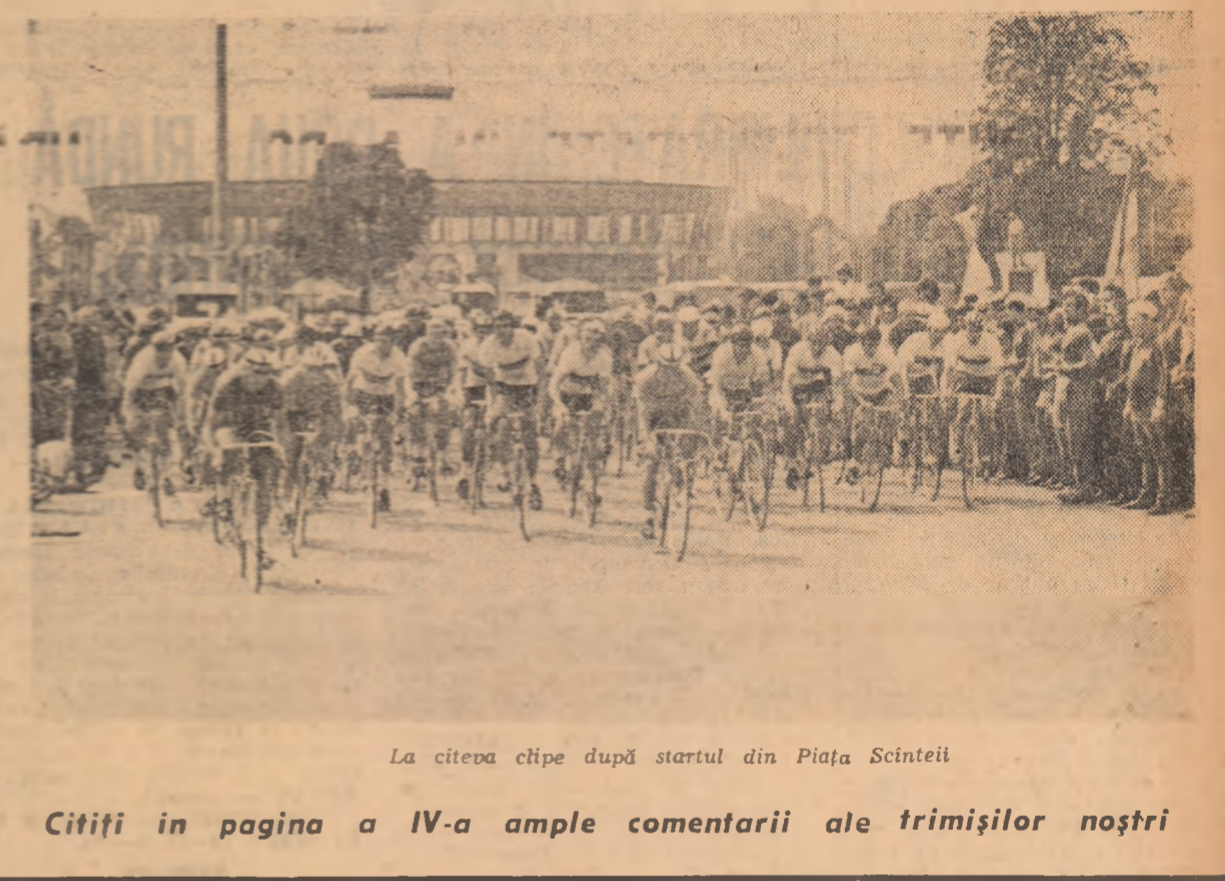
La cîteva clipe după startul din Piața Scintei

Citiți în pagina a IV-a ample comentarii ale trimișilor noștri