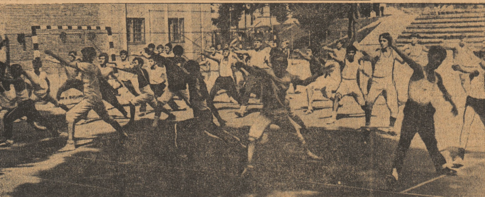
Stadionul Tractorul din Brașov va fi și în noul an universitar o gazdă primitoare pentru studenții din localitate. Iată o „zonă” a stadionului pe care în această vară au lucrat scrierile din tabără de copii și juniori a federației...