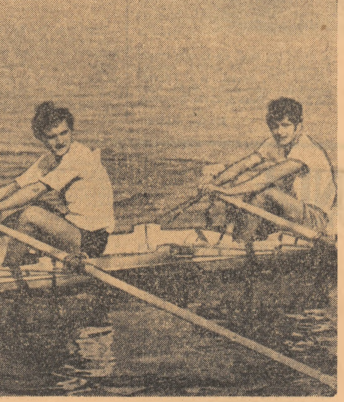
În încheierea campionatelor republicane de canotaj