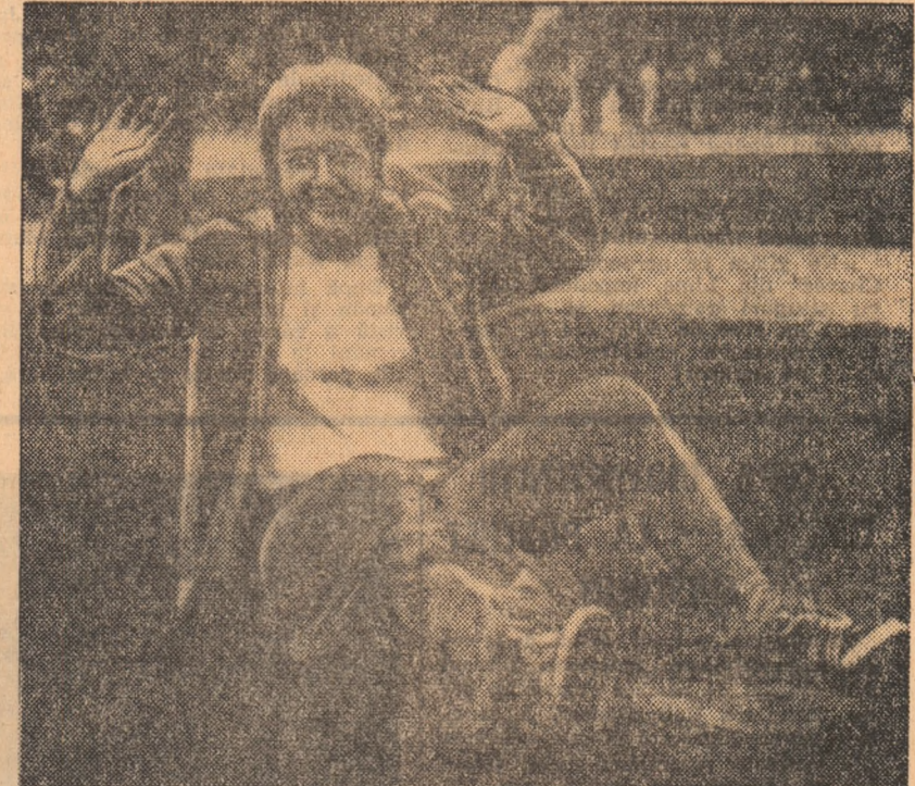
Ruth Fuchs e fericită pentru noul său record mondial la aruncarea suliței

în timp ce R.D. Germană a avut două victorii (100 m și 4x100 m), R.F. Germania tot două (400 m și 4x400 m), iar U.R.S.S. (10.000 m), Finlanda (3.000 m obstacole) și Franța (110 m) cîte una! O explicație a acestui succes ar putea fi în dragostea pentru alergare în teren variat a însușiilor. În zilele concursului, în parcul Holywood, cu clima ușoară de munte vulcanic, - chiar în perimetrul orașului - am văzut și zeci de oameni, din țările vizite, care alergau pentru propria lor plăcere, pentru sănătatea lor! De altfel, trotuarele soarelui care mărginesc acest parc sînt acoperite cu... tartan (!), pentru a crea un cadru corespunzător de antrenament celor doritori.