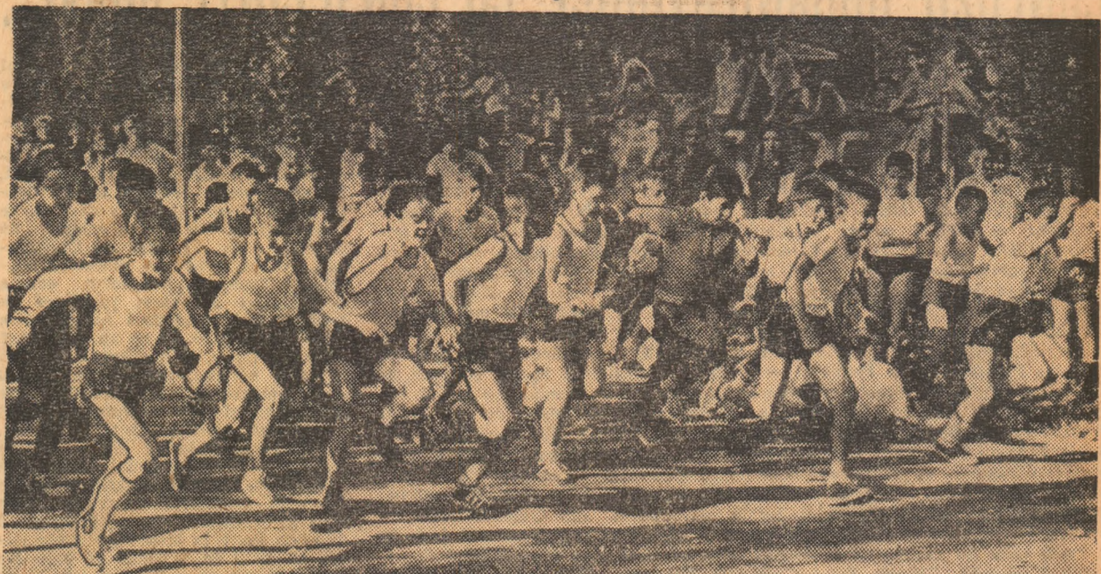
Cei mai mici concurenți au plecat în cursă la crosul desfășurat ieri în Parcul Herăstrău