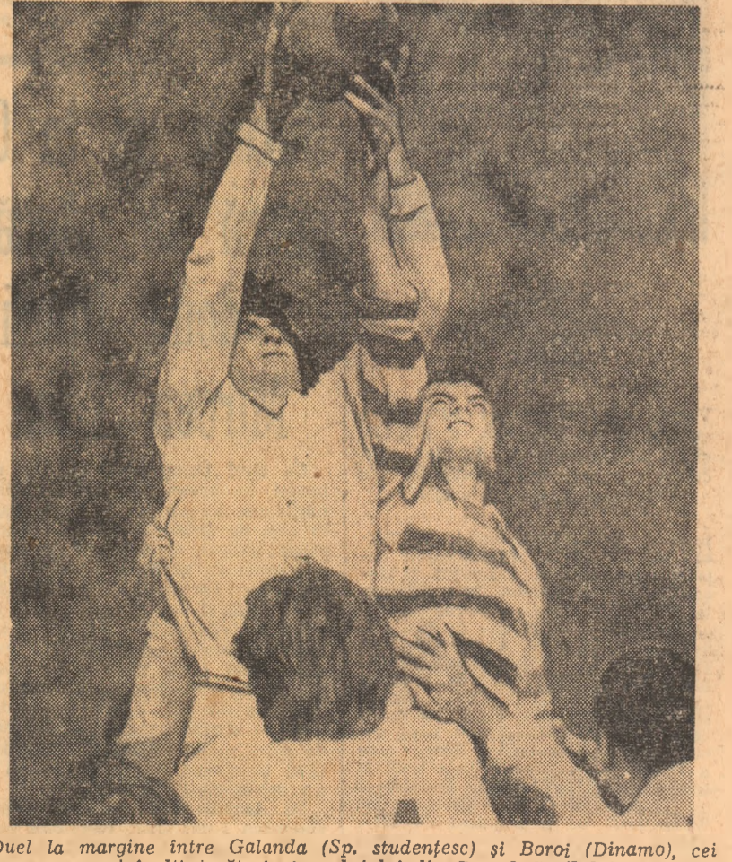
Duel la margine între Galanda (Sp. studențesc) și Boro (Dinamo), cei mai înalți jucători ai cuplajului din Parcul Copilului

tactic, și a unui val de căldură neobișnuit pentru luna care marchează debutul toamnei. Jocul, așa cum spunea, a fost curgător, fără pauze mari și dacă s-au marcat puține puncte (doar trei de fiecare parte), faptul se datorează unei apărări stricte, ca și unor gafe în fazele de finalizare. La început Dinamo a preluat inițiativa, confirmîndu-ne părerea că acest team va juca în noul campionat un rol mult mai însemnat decît în anii