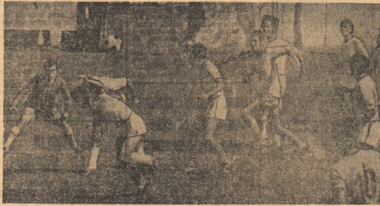
Partidele din „Cupa României” sînt întotdeauna disputate, așa cum se poate vedea și din această fază de poartă, surprinsă de fotoreporterul S. Bakcsy la meciul T.M.B. — Ș. N. Oltenița

Numeroase divizionare B au părăsit competiția după primul lor meci