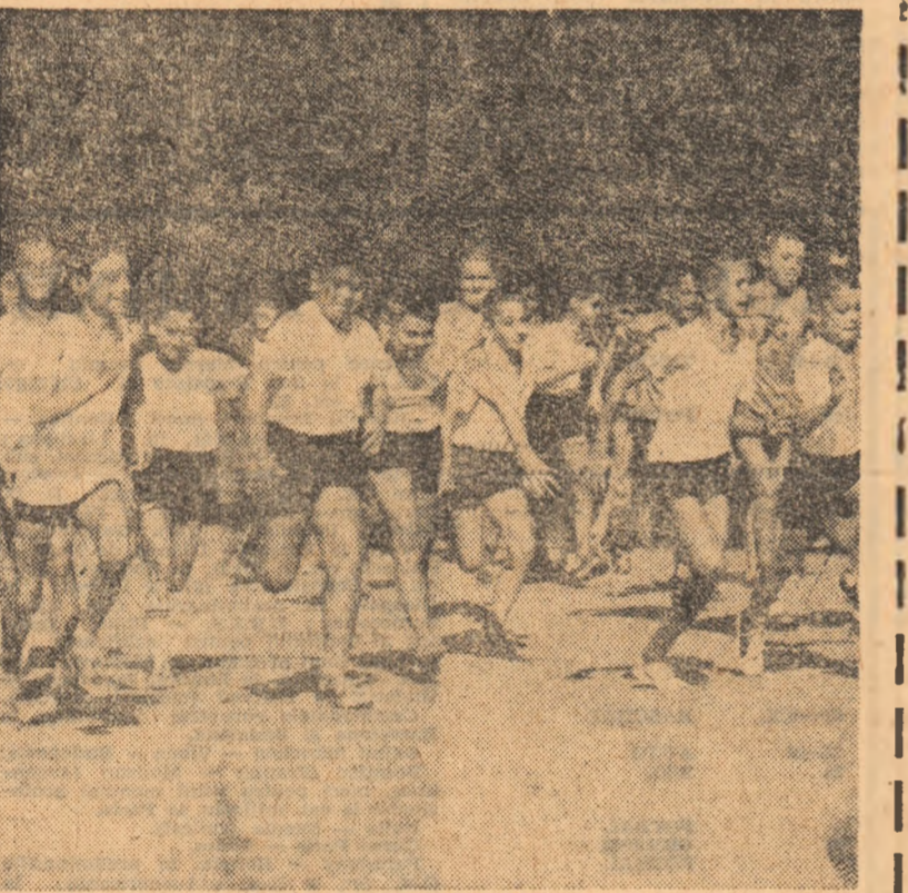
A început un nou an școlar! Micuții elevi ai Școlii nr. 120 din Capitală sînt participă cu toată voioșia lor la prima oră de educație fizică, întrecîndu-se într-o cursă de viteză