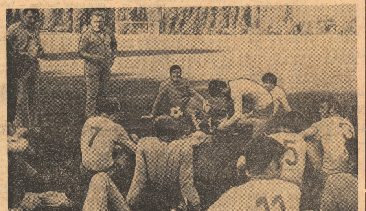
Ieri, la Snagov, ultimele secvențe de pregătire a meciului înaintea plecării.

Astăzi după-amiază, la ora 15, un avion special va transporta lotul reprezentativ de fotbal la Berlin, urmînd ca, de acolo, și pînă la Leipzig, selecționabilii să parcurgă cei 170 km cu autocarul.