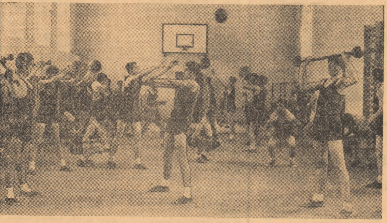
Sala de sport, realizată prin eforturi proprii, asigură elevilor Liceului agricol din Ciombrud posibilitatea de a avea o bogată și diversă activitate

● Când sportul face casă bună cu spiritul gospodăresc ● De la Liceul agricol din Ciombrud la Liceul pentru industrializarea lemnului din Blaj sau distanța de la pasiune la nepăsare ● În atenție — revitalizarea sportului sătesc ● Atletismul și voleiul nu vor fi lasate uitării