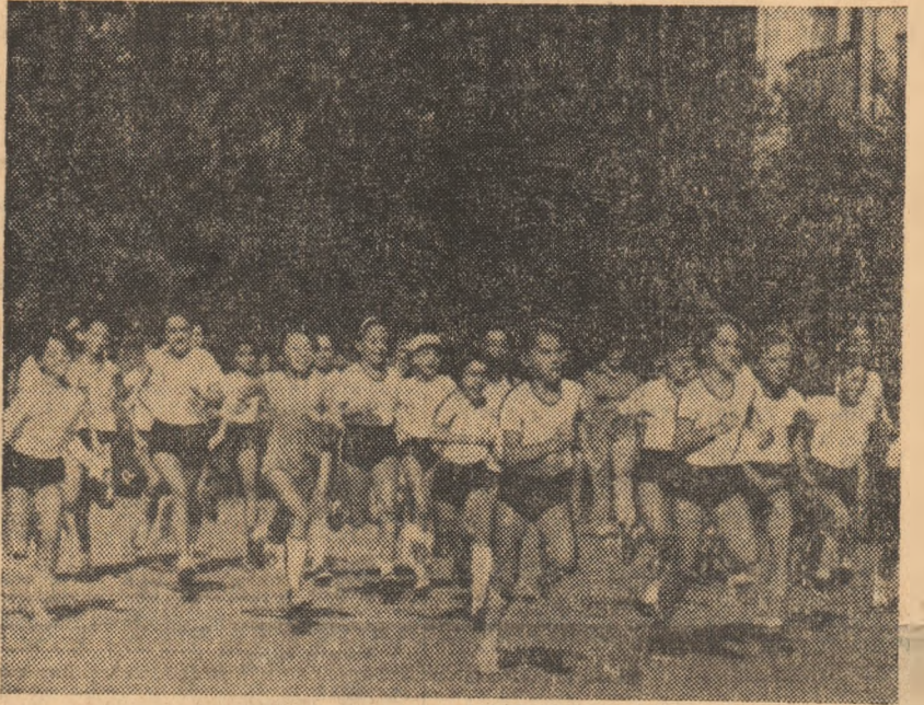
In aceste zile sute de copii au participat la tradiționalele întreceri ale „Crosului de toamnă”, organizat în Capitală.