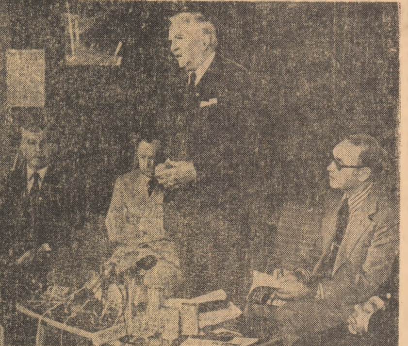
Aspect din timpul expunerii ținute de dr. Alois Lügger, primarul orașului Innsbruck

În aceste zile - așa cum am mai anunțat - o delegație sportivă austriacă, avînd în frunte pe dr. Alois Lügger, primarul orașului Innsbruck, vice-președintele al Comitetului de organizare a Jocurilor Olimpice de iarnă 1976, ne vizitează țara. În cadrul acestei vizite, ieri a avut loc la Casa Ziaristilor o conferință de presă, organizată de Asociația presei sportive române. Cu acest prilej, ziaristii români, prezenți la conferința de presă, au luat cunoștință de pregătirile care se fac în vederea organizării celei de a XII-a ediții a Olimpiadei albe, care va avea loc la Innsbruck, în iarna anului 1976.