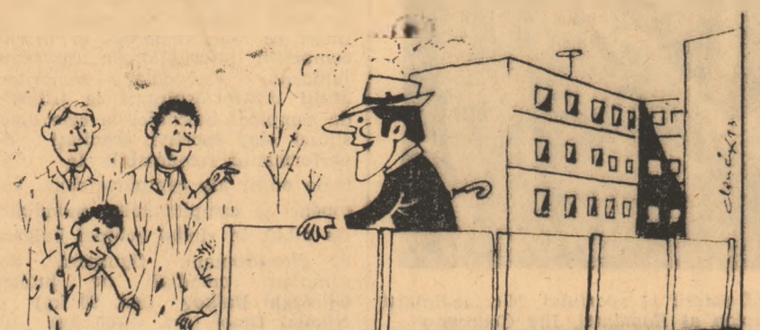
— Si, mă rog, ce căutați prin buruieni? — „Grija conducerii școlii pentru sport!”