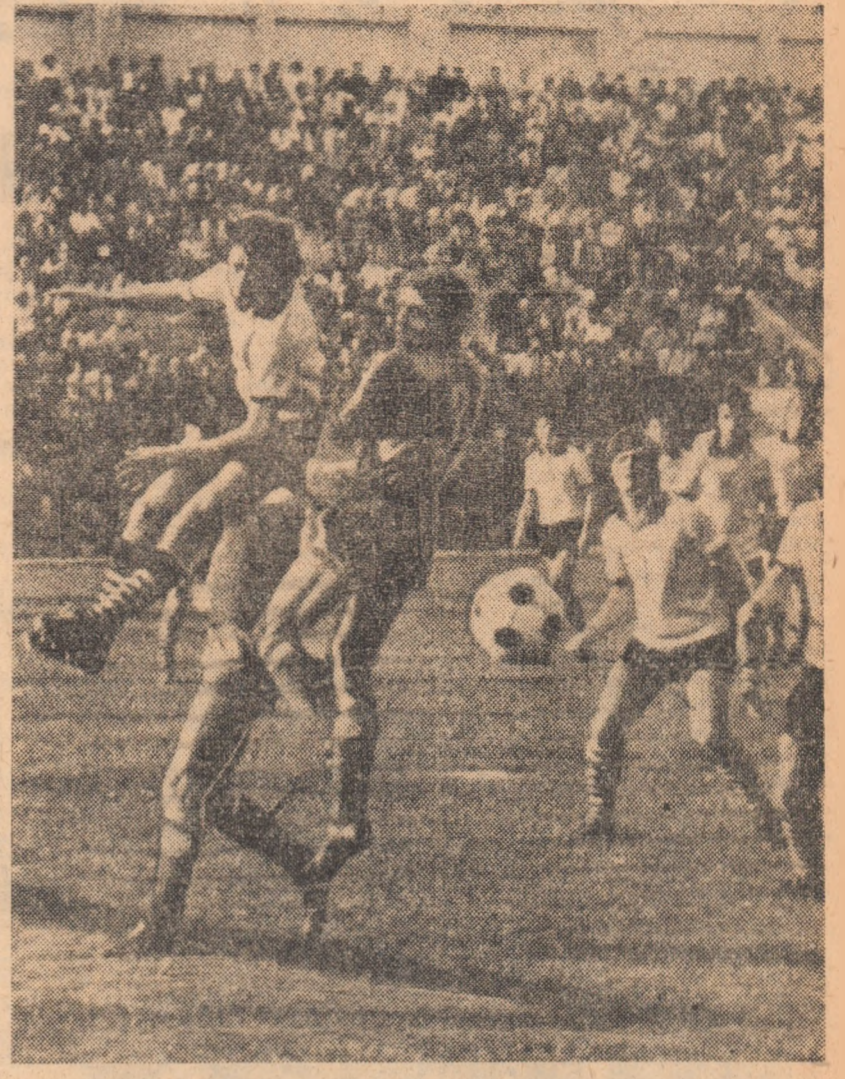
„Secvență” dintr-o partidă Steagul roșu — A. S. Armata Tg. Mureș, disputată în returul campionatului trecut la Brașov.

Astăzi, pe opt stadioane din țară, jocurile etapei a IX-a a Diviziei A marțeze trecerea în a doua parte a turului campionatului. Privind, cu atenție, alcătuirea programului observăm că majoritatea partidelor sînt echilibrate, prezentînd importanță pentru configurația clasamentului. Este și motivul pentru care nutim speranța că jocurile acestei etape ne vor da ocazia să urmărim întâlniri viu disputate. Cum pare a fi, cea de la Arad, dintre U.T.A. și Universitatea Craiova. Va fi o reeditare a ultimului act din campionatul trecut, al acelei dramatice întâlniri? Studenții craioveni, neliniști pînă acum, vor căuta să-și consolideze poziția de lider, avînd și suportul moral al calificării în turul al doilea al Cupei U.F.F.A. În Capitală, cuplajul echipelor bucureștene (Rapid — Dinamo și Sportul studentesc — Steaua) este așteptat cu de obicei, cu mult interes. Indiferent de poziția în clasament, pe care o ocupă cele patru formații, întâlnirile dintre ele ne-au oferit de fiecare dată dispute pline de neprevăzut. Pe litoral, F.C. Constanța, constantă în evoluțiile de pînă acum, primește replica lui F.C. Argeș, formație dornică de reabilitare după insuccesul de miercuri, cu Fenerbahce. Dar cu ce sînt mai prețioase, meciurile Steagul roșu — A.S.A. Tg. Mureș, Politehnica Timișoara — Jiul, S. C. Bacău — C.S.M. Reșița sau Petrolul — Politehnica Iași? Ca să nu mai vorbim de derbyul clujean, „U” —