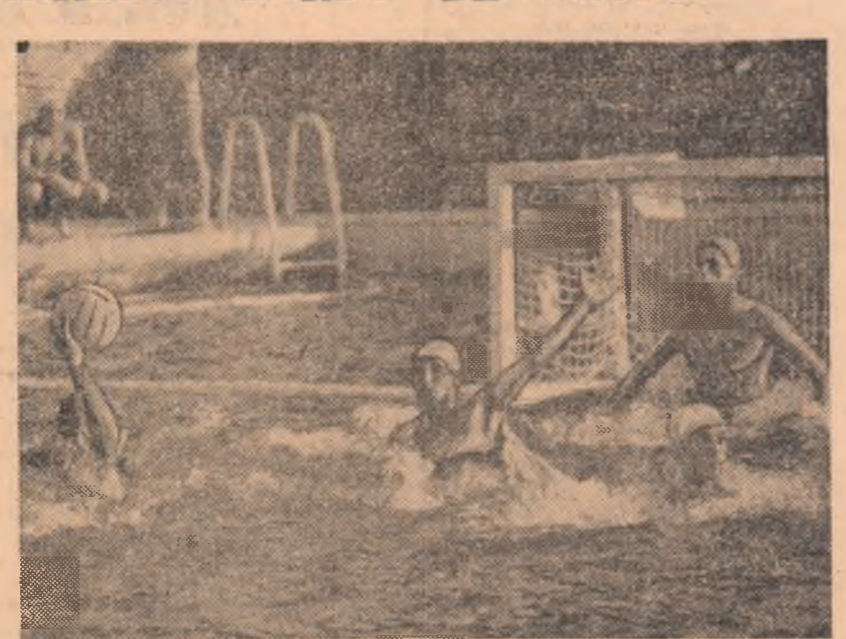
Cornel Rusu, unul dintre cei mai buni atacanți feroviar în meciul cu Progresul, se pregătește să pecuțuească scorul final (7-2)

ajuns în ziua derby-ului — bazinul Dinamo de la ora 12 — la egalitate de puncte, prima avînd avantajul unui golaveraj net superior: 1. Dinamo 14 12 1 1 111—36 25 2. Rapid 14 12 1 1 78—37 25