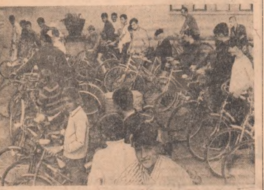
În comuna Voluntari, ciclourismul a devenit o pasiune constantă a elevilor. Iată un aspect premergător plecării într-o cursă