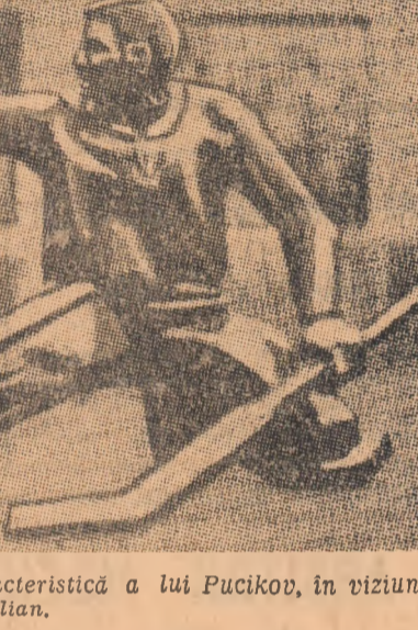
Iata miscarea caracteristica a lui Pucikov, in viziunea sculptorului G. Frangulian.