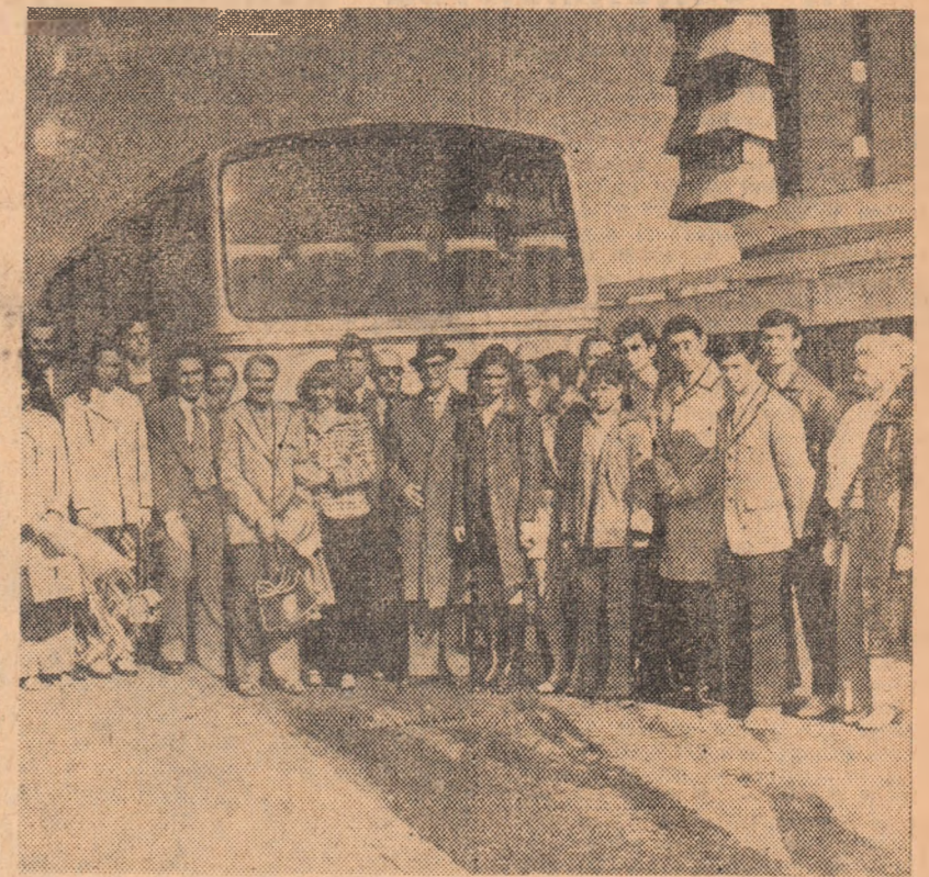
Patinatori și patinoare, la cîteva clipe înainte de parcurea ultima etape a călătoriei lor, între aeroportul internațional Otopeni și Miercurea Ciuc.

trenament, în vederea marilor concursuri. Este prima lor apariție pește hotare, în acest sezon. Sper că ea va satisface pe spectatori români, care au prilejul s-o revadă pe Irina Rodina, acum însă alături de noul ei partener, cu care a cu-