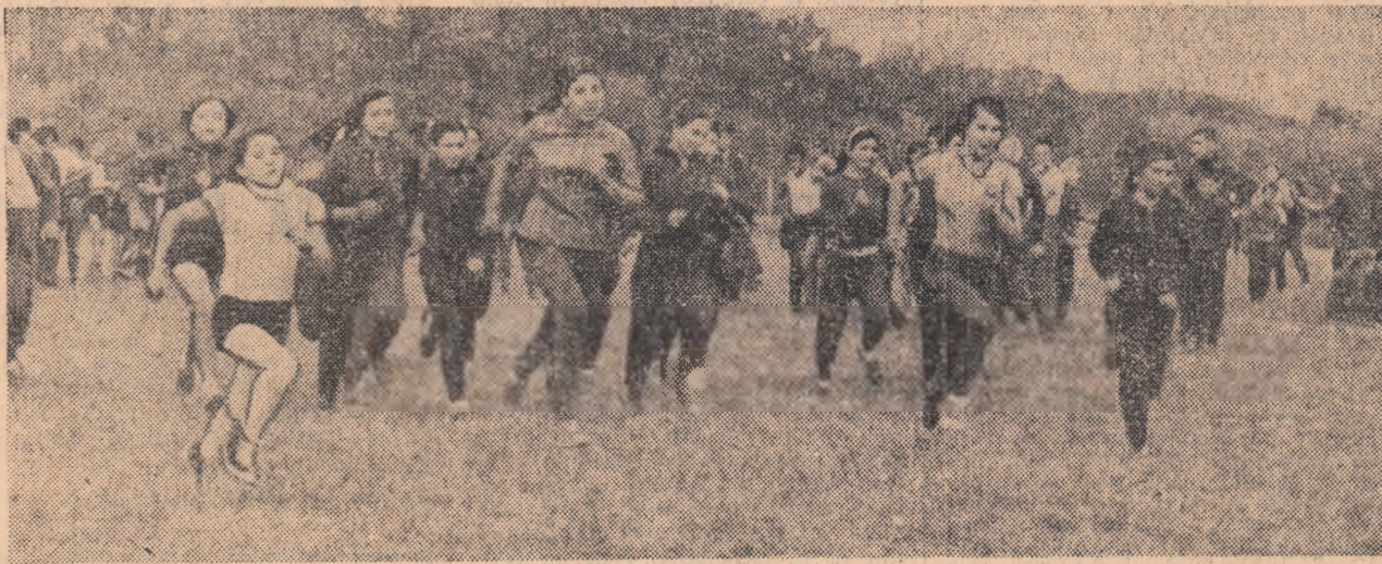
Cros pe Hipodromul craiovean

C.J.E.F.S. în colaborare cu C.M.E.F.S. Hunedoara a organizat