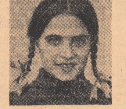
S-a născut la 8 noiembrie 1937 în orașul Lugoj...