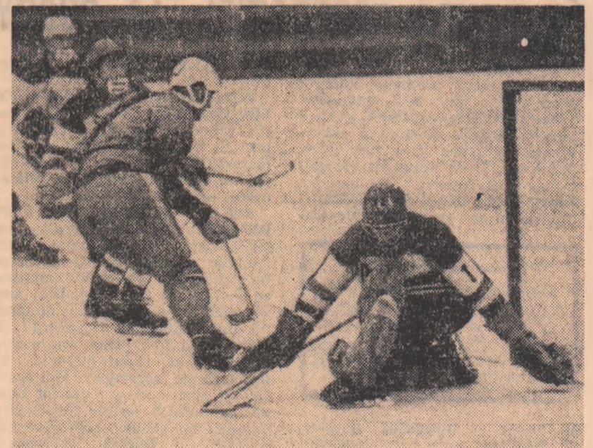
Un atac al hocheiștilor de la Steaua în meciul cu S.C. Miercurea Ciuc

chipei să dispute cît mai multe meciuri, oferînd în plus și ocazia unor frumoase revanșe sportive. Așa s-au petrecut lucrurile și cu una din partidele consumate în Capitală și anume aceea dintre I. P. G. G. și Liceul nr. 1 din M. Ciuc, în care — după ce învinseseră sîmbătă — elevii au fost nevoiți ieri să înlăture steagul. Dar, divizia A se află abia la