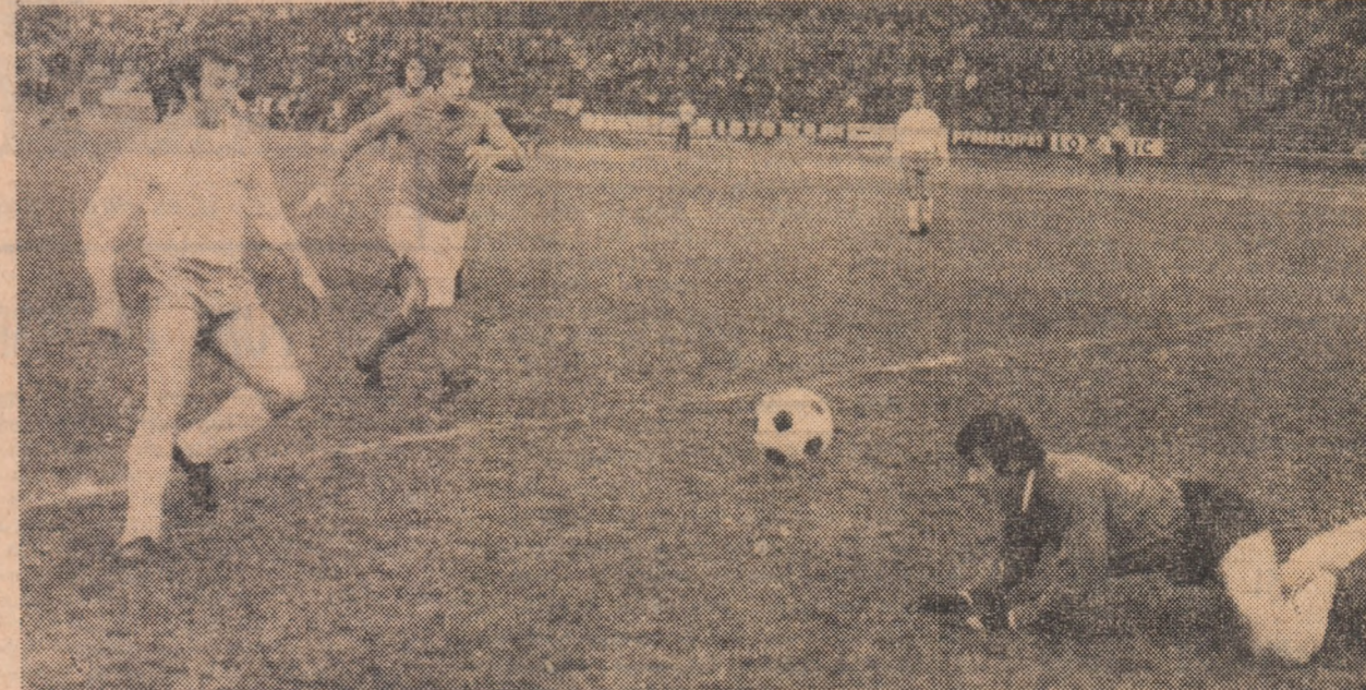
Așa a deschis Universitatea Craiova scorul, prin Bălan, în prima repriză. A fost un moment dator de speranțe într-o eventuală calificare în turul III al Cupei U.E.F.A., a liderului campionatului. Dar...