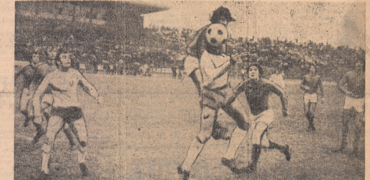
Nici de această dată atacul craiovean n-a reușit să fructifice una din ocaziile create la poarta echipei Standard Liège.