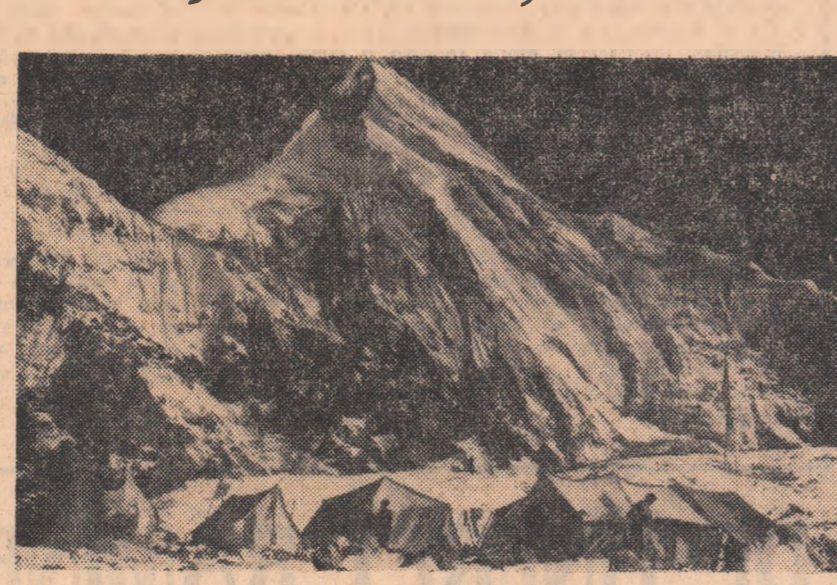
Zecce alpinisti uzbeki au reușit să cucerească picul Han-Tengri. Ascensiunea a fost înregistrată în ziua de miercuri, 16 zile de luptă crâncină a oamenilor cu forțele dezlănțuite ale naturii. Han-Tengri este al cincilea pic din Unitatea Sovietică (8963 m) și se află în masivul Tian San, din Asia mijlocie.

Pentru prima dată, picul acesta de o clasică formă piramidală a fost cucerit în 1931 de către o echipă de alpinisti sovietici având în frunte pe maestrul emerit al sportului M. Pogrebnik. De data aceasta, sportivii uzbeki au reușit, pentru prima dată, să escaladeze Han-Tengri pe partea dinspre sud-est. Din cauza condițiilor meteorologice extrem de nefavorabile, alpinistii au trebuit să rămână trei zile și trei nopți pe picul cucerit.