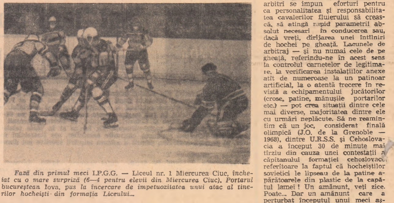
Fază din primul meci I.P.G.G. - Liceul nr. 1 Miercurea Ciuc, încheiat cu o mare surpriză (6-4 pentru elevii din Miercurea Ciuc), Portarul bucureștean Iova, pus la încercare de impetuozitatea unui atac al tinerilor hocheiști din formația Liceului...