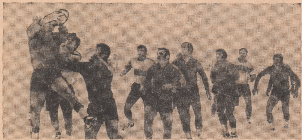
Net superioară, înaintarea campionilor câștigă un nou duel la tușă. Fază din întâlnirea Steaua — Chimia Năvodari, disputată ieri