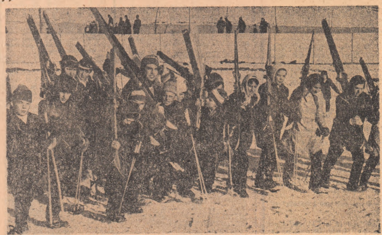
INTRECERI NUMEROASE ȘI ENTUZIASTE ÎN ÎNTREAGA ȚARĂ