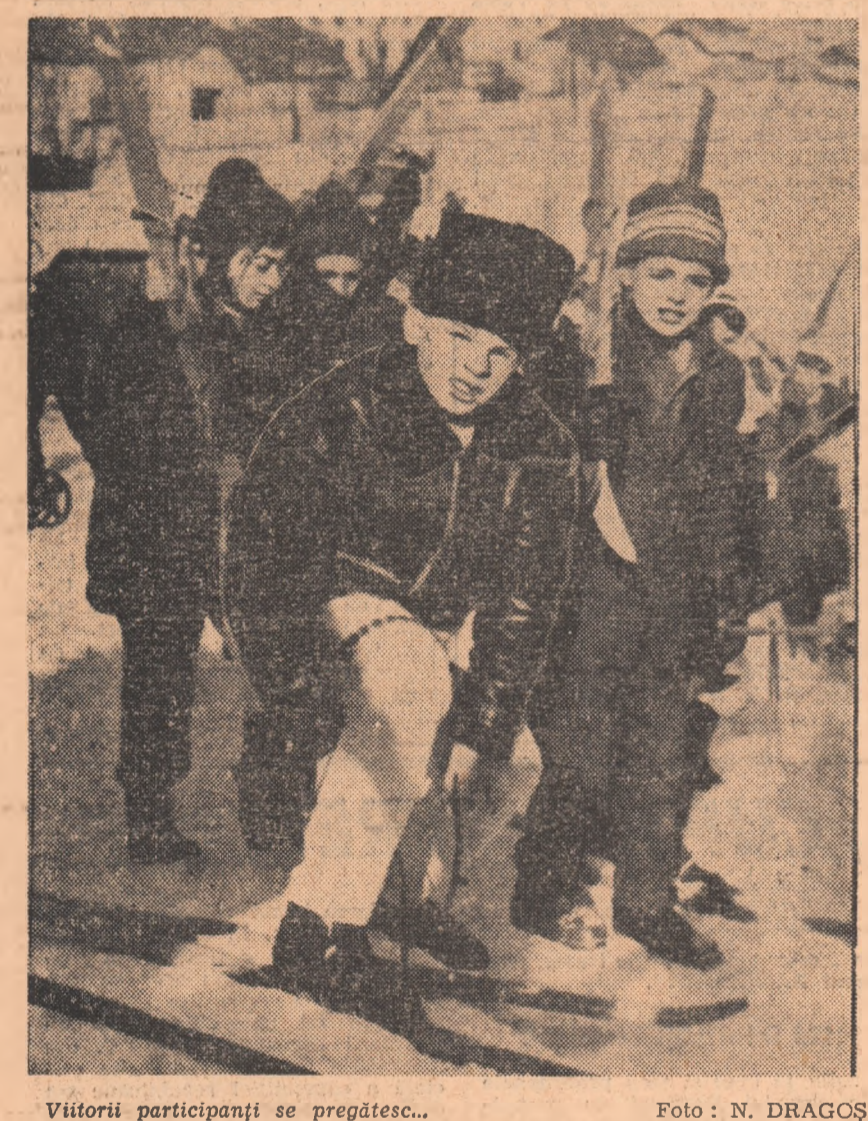
Viitorii participanți se pregătesc...

Dar se pare că liderii erau obosiți de luptă și n-au mai avut nici unul resursele necesare pentru a lucca la câștig. Înțelegîndu-se tacit să-și continue rivalitatea în meciul de baraj. Astfel, partidele centrale ale rundei a 19-a