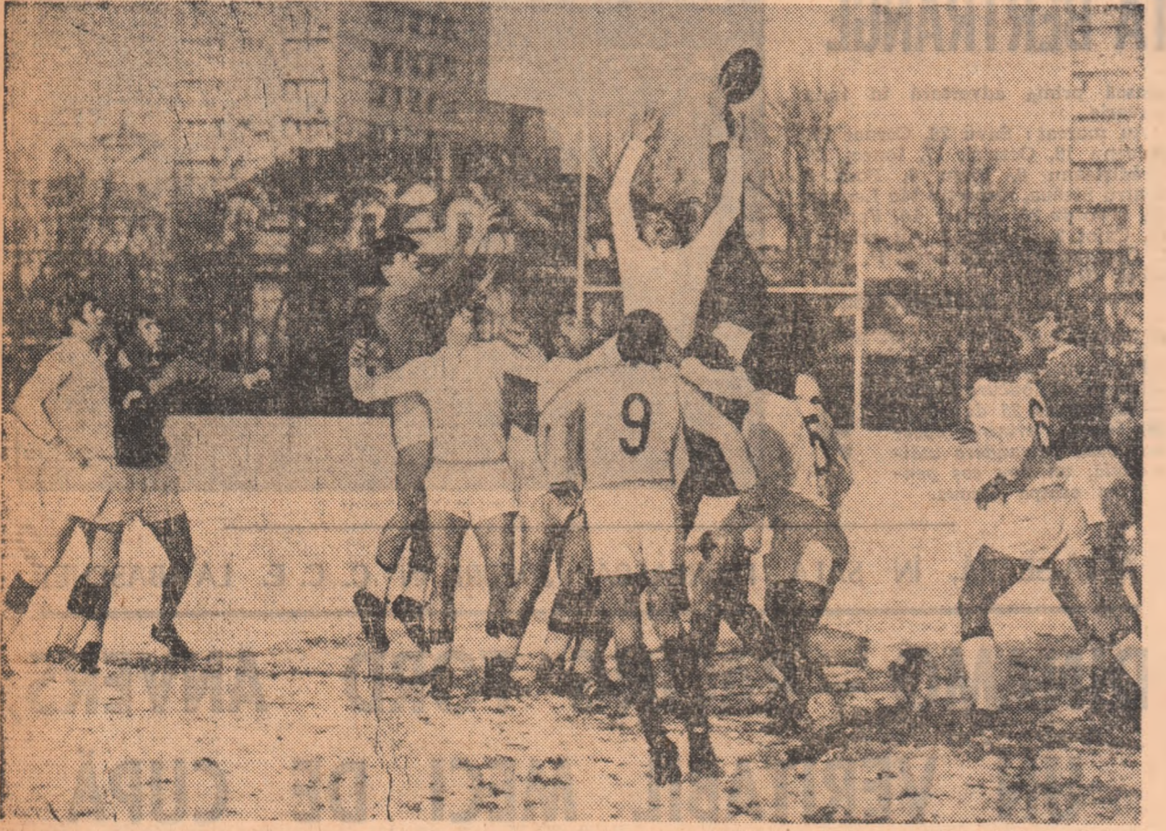
Dispută pentru balon între rugbystii de la Sportul Studențesc (în alb) și cei de la Grivița Roșie, într-o confruntare care a dat câștig de cauză echipei grivițene.

REZULTATE TEHNICE Știința Petroșani — C.S.M. Sibiu 4-4 (4-4), Grivița Roșie — Sportul studențesc 12-4 (12-4), Politehnica Iași — Agronomia Cluj 10-6 (10-0), Vulcan — Universitatea Timișoara 4-0 (0-0), Steaua — Gloria 27-4 (15-4), Chimia Năvodari — Dinamo 15-0 (6-0), Rulmentul Birlad — Farul Constanța 0-6 (0-0).