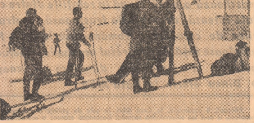
Turiști pe schiuri în Bucuți

— Care sînt realizările în domeniul turismului din județul Timiș în 1973? — A fost un an bun. În acțiunile organizate de B.T.T., O.J.T. secțiile de turism ale asociațiilor sportive și din grupele sindicale, de către cercurile turistice ale organizațiilor U.T.C., au fost cuprinși peste 95 000 de participanți. Însă, acțiunile au fost azvetezate mai mult pe excursii efectuate cu mijloace de transport și mai puțin pe excursii active.