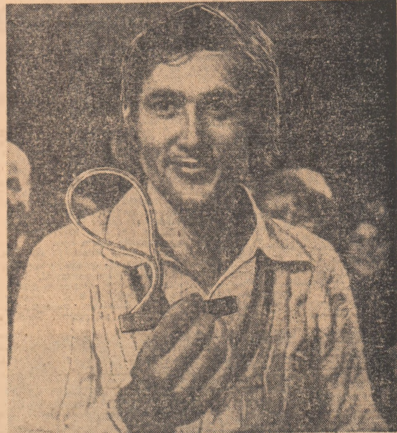
„Campionul campionilor“ tenisului și trofeul său, cucerit la Paris, acum doi ani, recîștigat apoi la Barcelona și acum, din nou, la Boston.