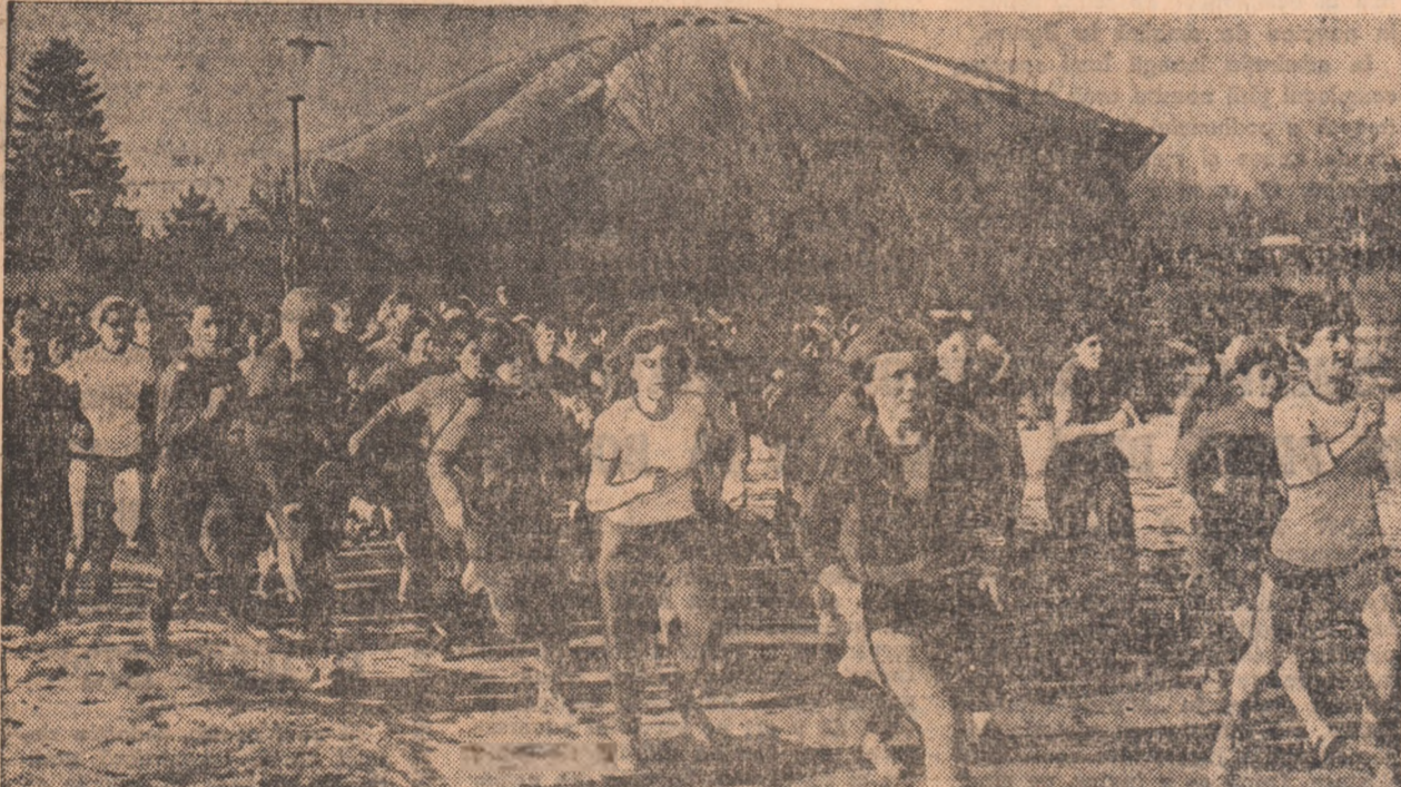
O imagine elocventă a succesului de care s-a bucurat, ieri, „Crosul campionilor“.