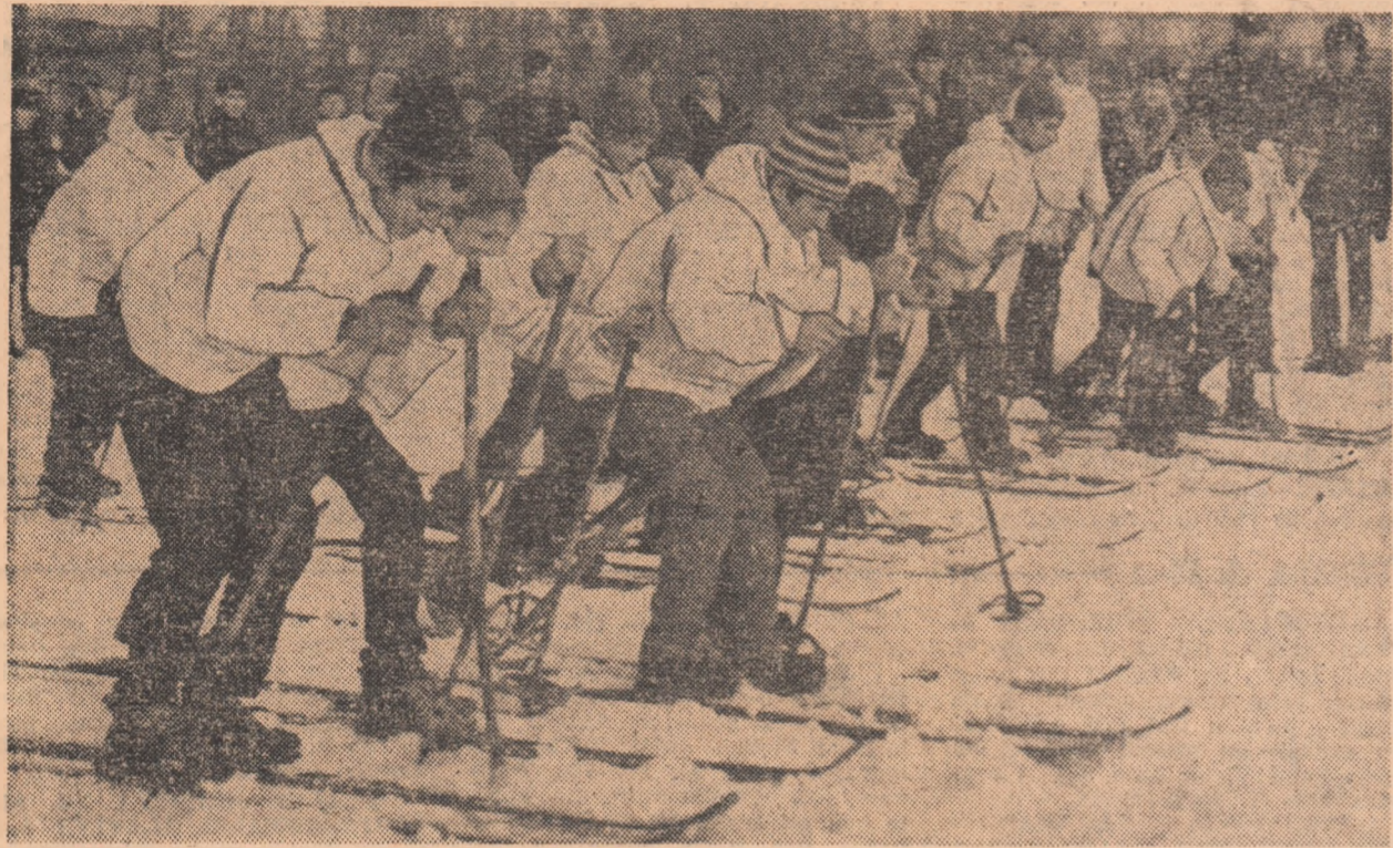
Pe stadionul Voința din Capitală zăpada s-a mai păstrat, încă, ca prin minune. Ucenicii meșteșugari au profitat și s-au întrecut în cadrul unor interesante concursuri

Marea competiție de masă cu caracter republican, „Cupa Tineretului“, a început ieri în întreaga țară. Timpul nu a fost pretutindeni prielnic desfășurării probelor specifice ediției de iarnă a întrecerii, valul de căldură toamnă, în multe locuri, gheața patinoarelor naturale și zăpada de pe pizile de schi și săniște. Dar, aceasta nu a împiedicat asupra momentului festiv al startului, asupra semnificației sale. Gospodarii grăjului au luat măsuri din vreme pentru a asigura condiții de desfășurare concursurilor de tenis de masă și de șah, care nu sînt la discreția vremii, ci depind exclusiv de priceperea organizatorilor.