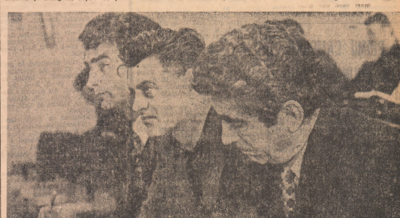
„Să ascultăm și experiența altora...“