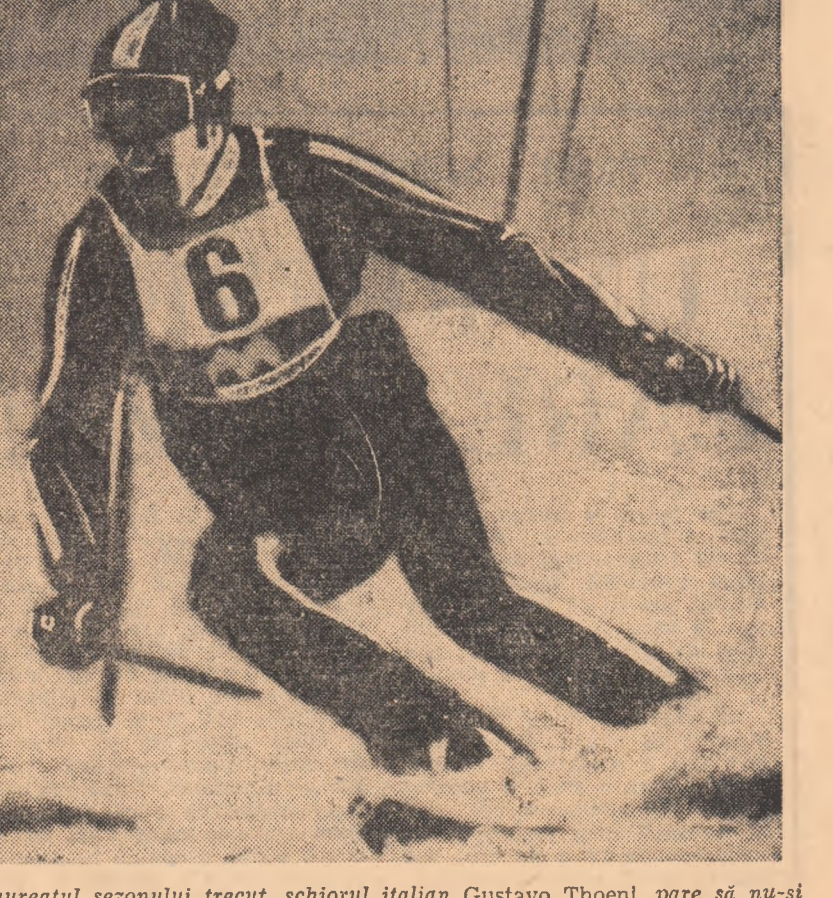
Laureatul sezonului trecut, schiorul italian Gustavo Thoeni, pare să nu-și fi găsit încă forma de zile mari.

A 6-a ediție a concursului de croșă la Granada (Spania) a fost câștigată de atletul scoțian Ian Stewart, cronometrat pe distanța de 9.000 m cu timpul de 28:35. Pe locul secund s-a clasat spaniolul Vicente Hato — 29:34, urmat de tîmăruianul Zaddem — 27:04 și englezul Steve Black — 27:06.4.