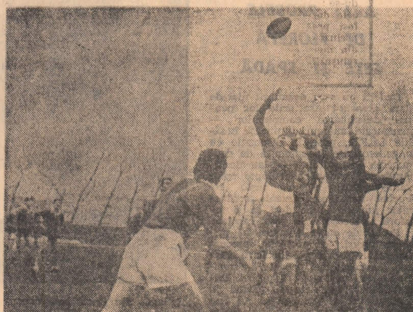
Rugbyul, o pasiune a tineretului buzoiian.

I și Școala sportivă Rimnicu Sărat în seria a II-a — la fete); pentru seniori: campionatul județean cîștigat de A. S. Zahăruț Buzău, iar în timpul iernii, „Cupa Buzăului” cu participarea selecționatelor feminine Cî. Buzău, Iași, Ploiești, Clărași și Rimnicu Sărat și a celor masculine din Ploiești, Clărași, Iași și Buzău; pentru neîncetăm: Spartachiada sîndicală, cu etapă finală pe județ.