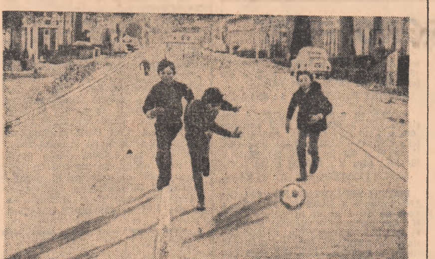
Fotbal pe autostrăzile Olandei, devenite puștii duminică, din cauza crizei de carburant...

VIENA, 19 (Agerpres). — „Cupa Mondială“ la schi a programat la Zell am See (Austria) o cursă masculină de coborire, în care victoria a revenit sportivului austriac Karl Cordin. Învingătorul, în vîrstă de 25 de ani, a fost cronometrat pe pîrtia în lungime de 2.670 m (diferență de nivel 768 m) cu timpul de 1:47,43 fiind urmat de elvețianul Roland Collombin — 1:47,77. Pe locurile 3-5 s-au clasat austriecii J. Feversinger, M. Gabler și J. Walcher — toți trei crediții