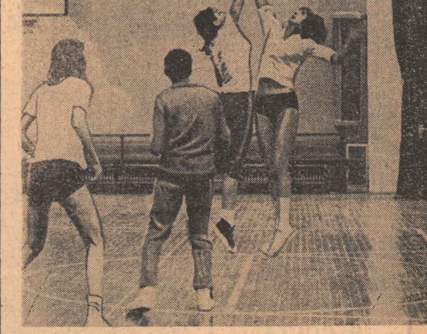
În centrul terenului de baschet, luptă pentru balonul... oval