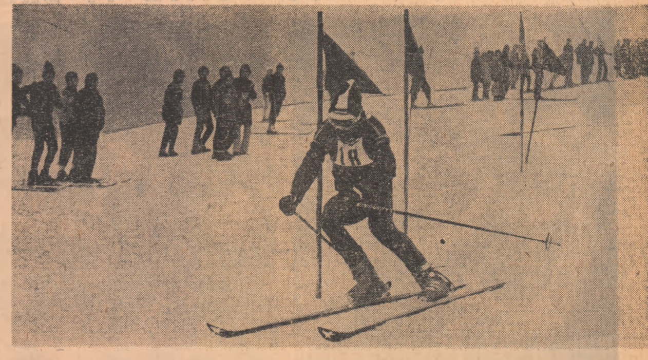
Instantaneu pe pîrtia Clăbucetului într-un moment identic: deschiderea oficială a unui sezon de sporturi de iarnă în care schiul constituie, firește, „capul de afiș”