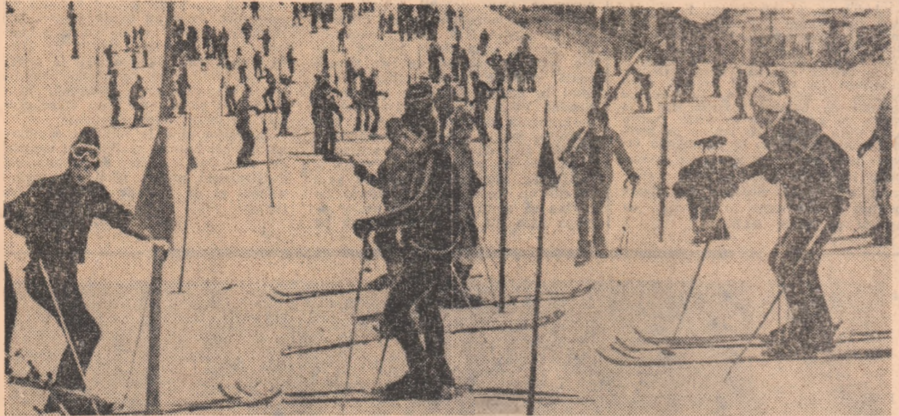
Cifra dintre participanții concursului de deschidere a sezonului oficial de schi, urcă pîrta Clăbucetul Taurului.

PREDEAL, 23 (prin telefon). Încă din primele ore ale dimineții, cîteva mii de schiori și spectatori, în majoritate elevi și studenți aflați în prima zi de vacanță, urcău în șiruri lungi, netreburate, spre pîrta Clăbucetului — locul de adunare și de întrecere ale concurenților, veniți la invitația federației pentru concursul-demonstrație de debut.