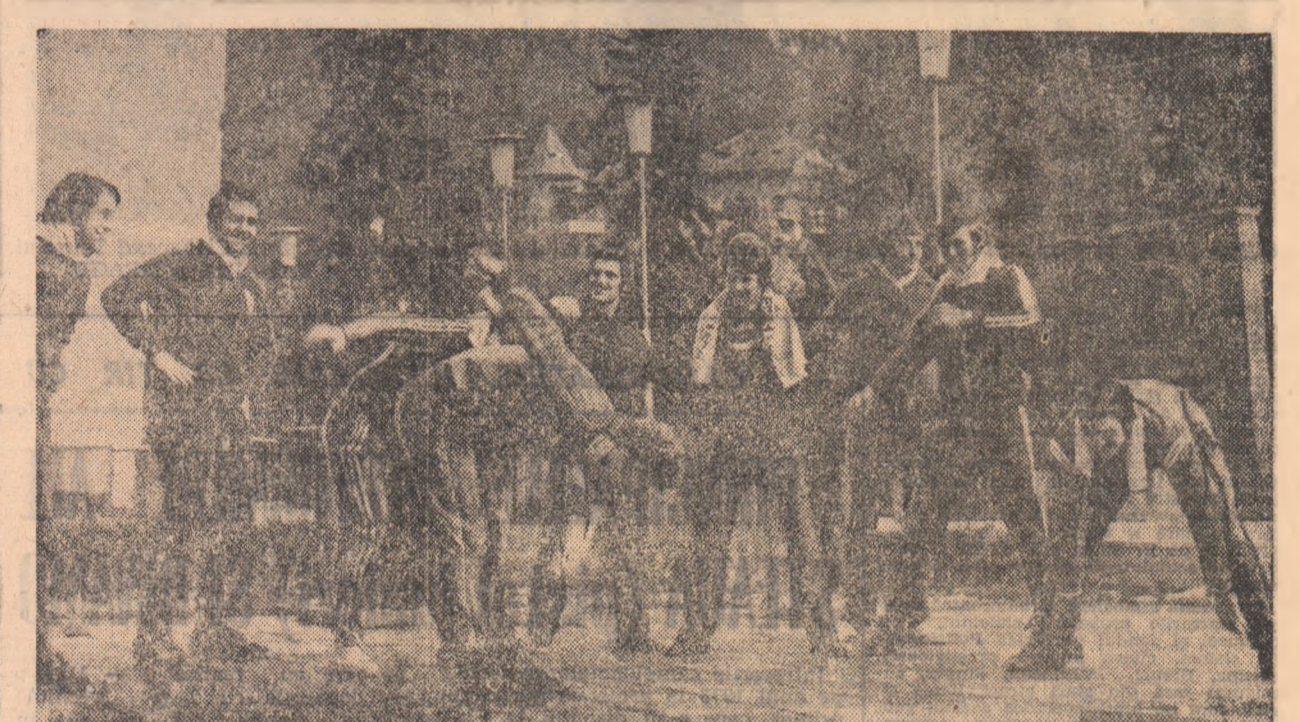
Pentru cîteva zile, lotul republican de judo s-a aflat la Herculane. După cum se știe, la începutul anului viitor sportivii din acest lot vor participa la două importante competiții - campionatele internaționale ale României și turneul de la Tbilisi.

Într-o duminică, în sala clubului municipal. I.L.T. au avut loc întrecerile primei faze la tenis de masă - la start fiind prezenți 64 de concurenți!