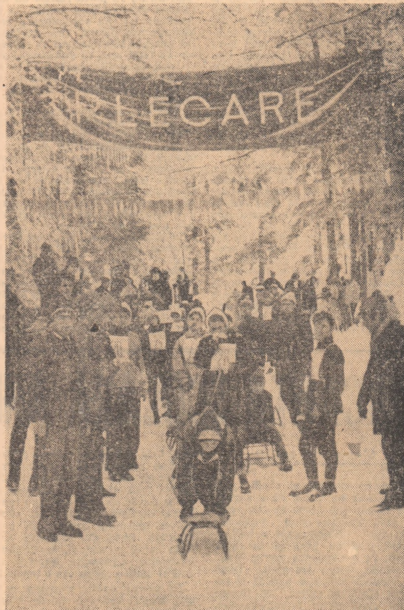
Copiii așteaptă cu nerăbdare zăpada pentru a-și măsura forțele pe derdeluş, ca în această imagine surprînd la finalele întrecerilor pentru „Să-niște de argint” incluse acum în cadrul ediției de iarnă a „Cupa tineretului”.

Aici, în sala mică (cea mare găzduia niște cursuri de pregătire pentru educatoare, ca și cum în tot sectorul nu ar exista un loc potrivit pentru asemenea activități) la două mese de ping-pong, elevii