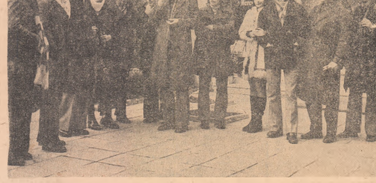
Fotbalisții de la Sportul studențesc, dintre care unii cu soțiile, fac o fotografie. Pe spatele pozei vor scrie desigur: „Amintire de la Herculane, vacanța lui 1973-74”.