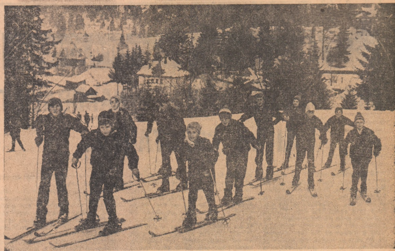
Sporturile ediției de iarnă a „Cupei Tineretului”, printre care schiul se situează la loc de frunte, atrag numeroși tineri pe pîrțile acoperite de zăpadă. Unii dintre aceștia au și luat cu asalt... Predealul.