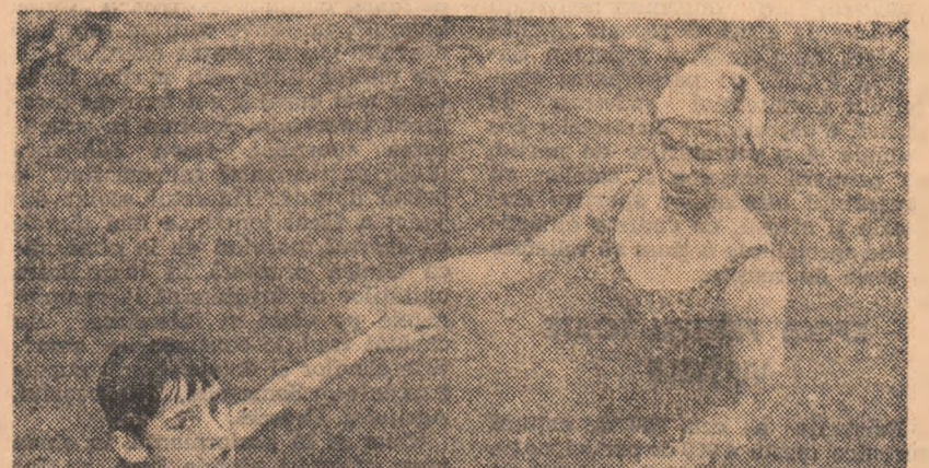
Iată două binecunoscute gimnaste ale țării noastre, într-o postură mai puțin obișnuită. Nadia Comănești și Elena Ceampelbe în bazinul cu ape termale de la Băile Fieș, unde cele două sportive s-au aflat pentru o scurtă perioadă, în vederea vindecării unor traumatisme.

numai gimnaste române și sovietice. Felicia Bejan, reprezentantă a gimnasticii românești, a ocupat locul al doilea la două aparate. ● Selecționete de juniori ale orașelor Brașov și Pleven (Bulgaria) s-au întlnit, timp de două zile, în sala clubului Dinamo din Brașov, în acest concurs bilateral cu exerciții liber alese. Competiția s-a bucurat de un frumos interes sportiv nașpeți, reprezentanți și una unități cu profil de gimnastică, reușind să cîștige atât concursul cit și - surprinzător - unanimitate ale publicului spectat. Ca memento, primul la individual masculin a avut-o Venceslav Bilan (Cupa s-a clasat Venceslav Ghenov (Pleven) cu 54,80 p. Dintre brașoveni o bună comportare au avut I. Seciu (locul 3 la bară cu 8,95) și