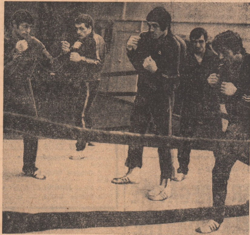
Primul antrenament al constanțenilor în București.

Constanțenii, dornici de o comportare cât mai bună, au și sosit la București și în aceste zile se antrenează de zor în sala clubului Steaua. Boxerii de pe malul mării sînt hotărîți să confirme speranțele puse în ei. De altfel, antrenorii au adus un lot deosebit de puternic, care cuprinde numeroși boxeri cunoscuți în arena internă și internațională. Printre aceștia se află Aurel Mihai și Ibrahim Faradin (campioni naționali la categoriile semimuscă și muscă), Augustin Ia-