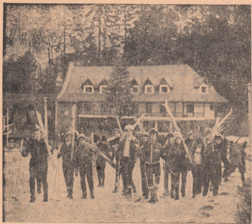
Ultimele zile de vacanță la cabana Firul rece. Elevi și eleve de la liceul „Dimitrie Petrescu” din București se îndreaptă spre pârte pentru a participa la un concurs de schi organizat în cadrul „Cupei tineretului”.

Federația noastră de fotbal a primit, în cursul zilei de ieri, confirmarea forului de specialitate din Atena privind jocul dintre primele reprezentative ale ROMÂNIEI și GRECIEI în ziua de 29 mai, la București. Revansa acestei partide se va desfășura în toamnă, la Atena, la o dată ce urmează să se fixeze ulterior.