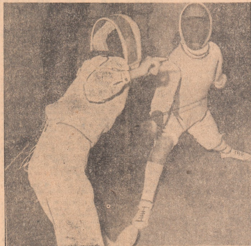
Dispută dîrză pe planșă, în turneu final!

SCRIMĂ LAURENȚIA VLĂDESCU (Școala sportivă I): „M-am pregătît zilnic, cîte două ore, sub îndrumarea antrenorilor mei...”