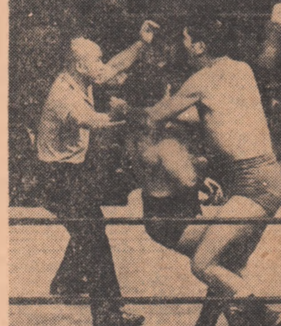
ANTON GEESINK ÎN JAPONIA