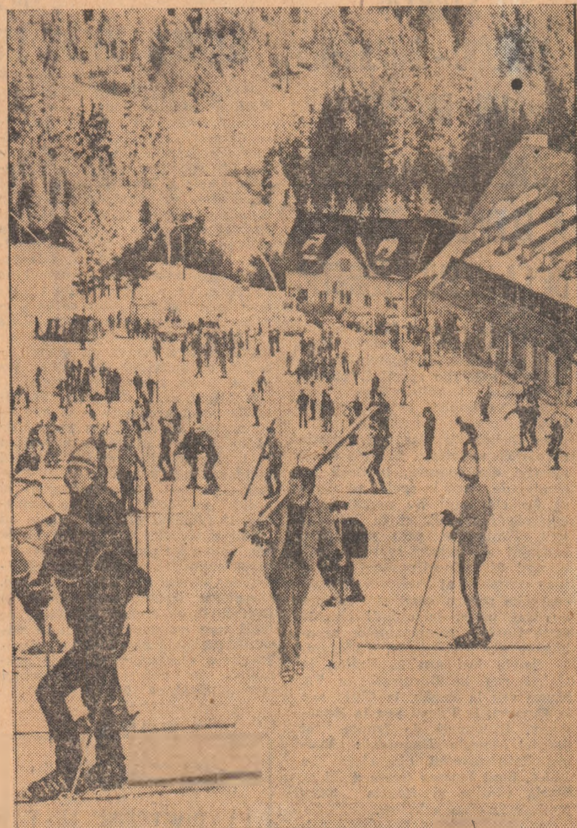
Elevii din școlile de toate gradele au populat din plin pîrțile Bucușilor, în zilele vacanței de iarnă. Un aspect de pe Clăbucei, cel mai important centru al vacanței din zona Văii Prahovei...

• O temă de actualitate (și de meditație) acum, la reînceperea cursurilor • Sarcini și responsabilități sporite pentru profesorii de educație fizică • Mai mult și mai bine! — acesta este cuvîntul de ordine în spiritul Do-cumentelor de partid