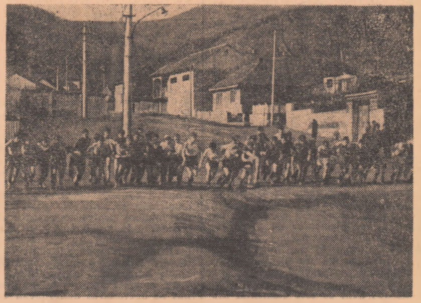
În fiecare săptămână, alergare în teren variat. Aspect de la unul din obișnuitele crosuri școlare reșițene

dacă toate cadrele de specialitate ar colabora în permanență, ajungând să lucreze pe grupe de probe — cerință de bază a antrenamentului modern. Și, în această direcție, o primă măsură organizatorică este pe cale de a fi concretizată: începând din anul 1974, atleții reșițeni vor activa în cadrul unui club de specialitate, unde vor avea condiții de pregătire superioare.