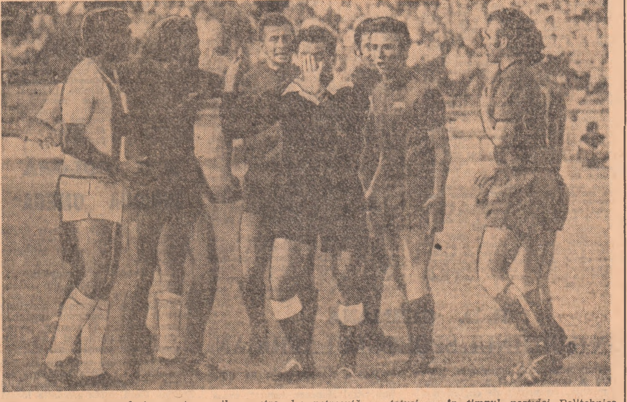
O scenă pe care n-o dorim pe terenurile noastre, dar petrecută — totuși — în timpul partidei Politehnica Timișoara — A.S.A. Tg. Mureș.