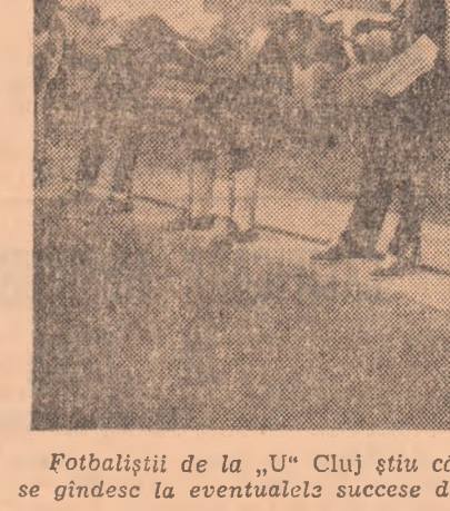
Fotbaliștii de la „U” Cluj știu că adevărații gospodari își fac iarna car și vara sanie. Trudind acum, în săli, se gîndesc la eventualele succese de pe gazon.

În fața „sălii de atletism”, Universitatea Cluj execută încălzirea dinaintea celei de a cincea ședințe de pregătire.