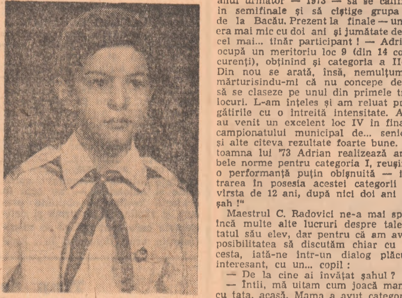
Întotdeauna, categoria a III-a. Chiar de la această primă apariție, specialiștii eschierului ploieșten au fost uimiți de ușurința cu care „pionierul” calculează variante complicate, de combinate, clarvizionul și „simțul tăbierii” dovedite de el.