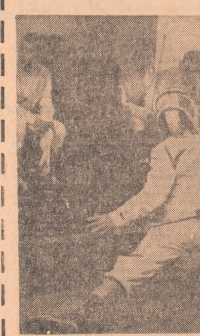
Un asalt din preliminariile probet masculine de floretă.

Prezidențiului forului de specialitate au fost noi depășite: la finala campionatului republican de floretă pentru copii s-au prezentat un 30, ci peste 70 de concurenți! Adică, așa cum prevede regulamentul competiției, jumătate din numărul trăgătorilor la faza pe localități. Iată o primă subliniere pe care ne simțim dator să o facem pe marginea acestei în-