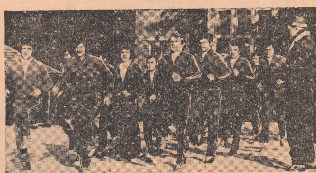
Scurtă „încalzire”, în fața cabanei Ghiocelul, înaintea startului în crosul de 3 km.

Turneul echipei naționale — proiectat, după cum se știe, pentru perioada 20 ianuarie — 1 februarie în Algeria și Spania — se află la această oră sub semnul incertitudinii. Federația spaniolă de fotbal, preocupată de pregătirea optimă a echipei naționale, care va înfîlți la 13 februarie echipa reprezentativă a Iugoslaviei, într-un meci decisiv pentru calificarea la C.M. '74, a procedat zilele trecute la o restructurare a programului campionatului, fixînd o etapă la