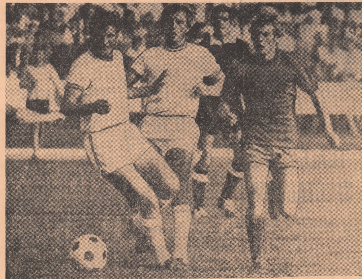
BALACI — MEZINUL CAMPIONATULUI