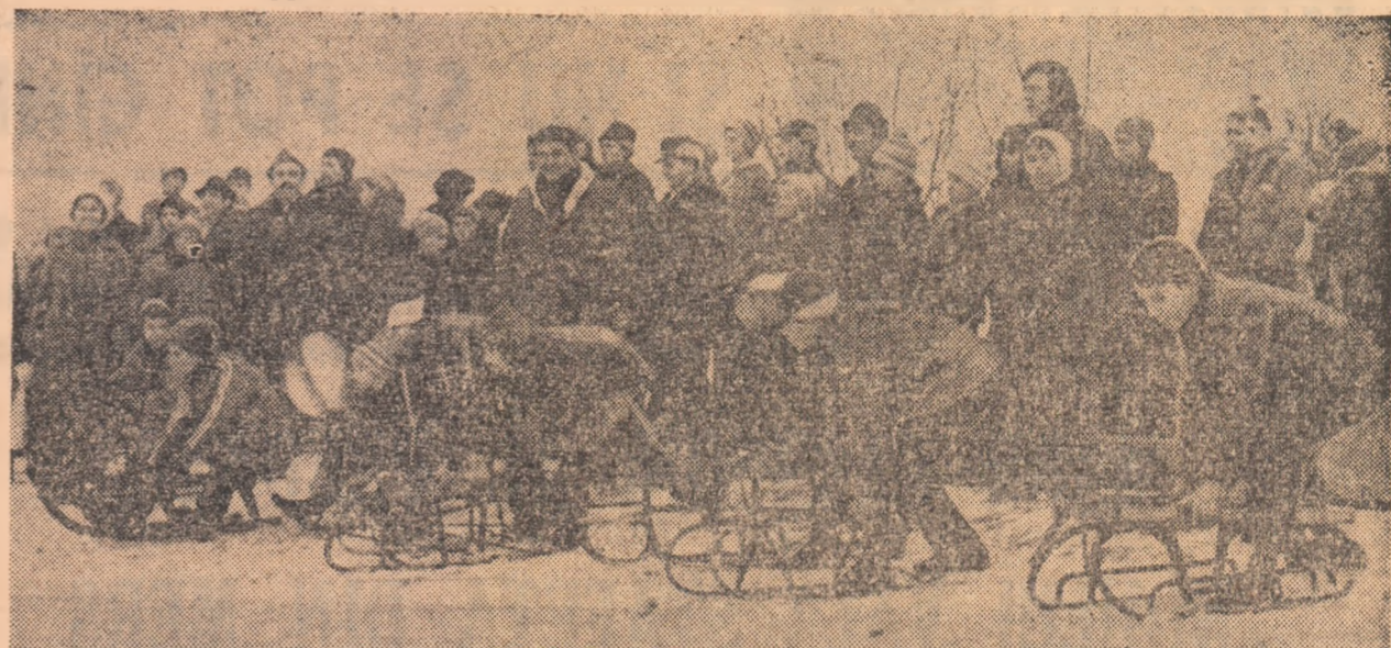
Mulți elevi bucureșteni au participat duminică la concursurile de sănătate organizate în „Parcul tineretului”.

Duminică, în multe localități din țară, au continuat întrecerile pentru „Cupa tineretului”. Cel mai mulți elevi, studenți, muncitori, funcționari au fost prezenți la startul competițiilor de schi, patinaj și sănătate. Totodată, în săli au avut loc meciuri de tenis de masă și confruntări de sah